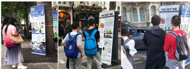
游客在真相展板前仔细阅读，想了解更多真相。

没有法轮功，这是迫害元凶江泽民为镇压制造借口而诌出来的，党媒就随声附和造舆论。学生们听后点头说明白了。紧接着学员说，中共搞谎言欺骗的例子比比皆是。比如，它搞的大跃进、什么亩产万斤等，结果造成三年大饥荒，饿死几千万人，中共硬说是自然灾害，其实那三年风调雨顺。听到这里，学生们面面相觑，也恍然大悟，最终都声明退出中共组织。学员还分享自己和公婆炼功后身心健康、消除怨隙的心路历程。一个女学生说：谢谢您讲的这些，原来法轮功这么好！