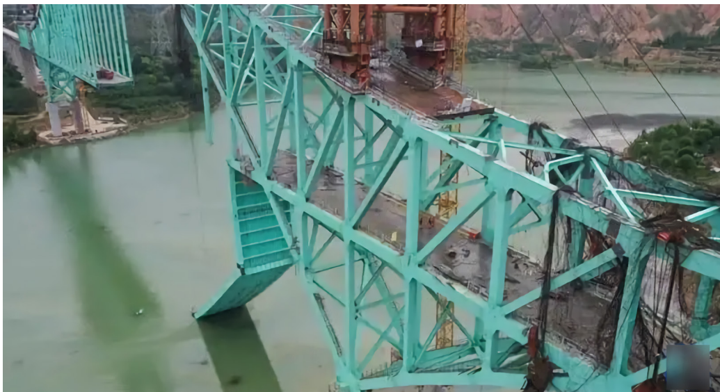
8月22日川青铁路青海段尖扎黄河特大桥事故现场（无人机照片）。

由中国中铁集团施工的川青铁路青海段尖扎黄河特大桥，8月22日凌晨发生钢索断裂事故，导致16名施工人员跌入水中，包括15名施工人员、1名工程项目部负责人。