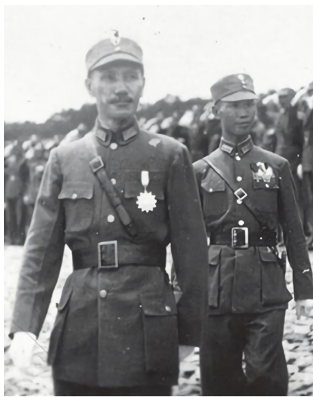
蒋介石在庐山军官训练团视察。

台湾励志协会（TIA）执行长赖荣伟对大纪元表示，中共的纪念抗战宣传令人啼笑皆非，有反讽意味。而搞阅兵则凸显它是一个独裁政权，“独裁政权视军事武