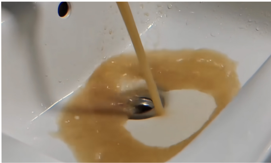
杭州余杭区良渚街、仁和街住户，7月16日发现自来水传出化粪池味道的刺鼻异味。

官方却否定了粪水说法。7月16日，余杭环境水务集团称，16时30分主管网已恢复正常，未梢