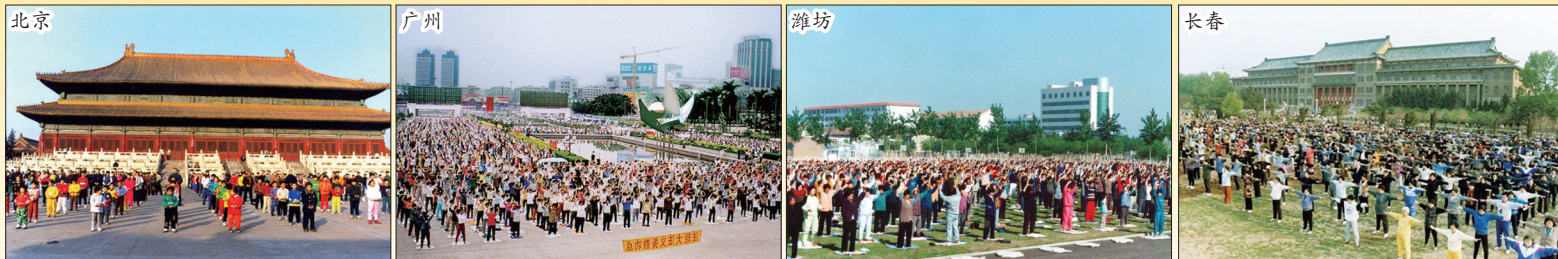
▲ 1999年7月20日迫害法轮功前，法轮功修炼者遍布全国每一个城镇和乡村。