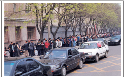
左图:1998年武汉五千名法轮功学员排出法轮图形及真善忍。右图:上万名法轮功学员到中南海附近的中央信访办和平上访，整个过程秩序良好交通井然。