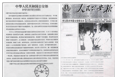
1993年公安部感谢信和《人民公安报》报道法轮功为见义勇为先进份子提供康复治疗

1992年法轮大法公开传出至1994年,应各地气功组织、气功科学研究会或政府单位的邀请,李洪志先生在全国23个城市共举办56期法轮功传授班,每期约十天,约六万人次参加,所到之处均受到热烈欢迎。