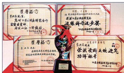
李洪志先生在北京东方健康博览会上获“边缘科学进步奖”“特别金奖”及“受群众欢迎气功师”称号。

官方的中国气功科学研究会向李洪志先生颁发气功师证书，1993年又向北京法轮功研究会颁发“中国气功科学研究会直属功法登记证”。同年8月31日中国公安部所属中华见义勇为基金会致信中国气功科学研究会，感谢李洪志先生为全国第三届见义勇为先进分子表彰大会代表免费提供康复治疗；12月27日同基金会授予李洪志先生荣誉证书。