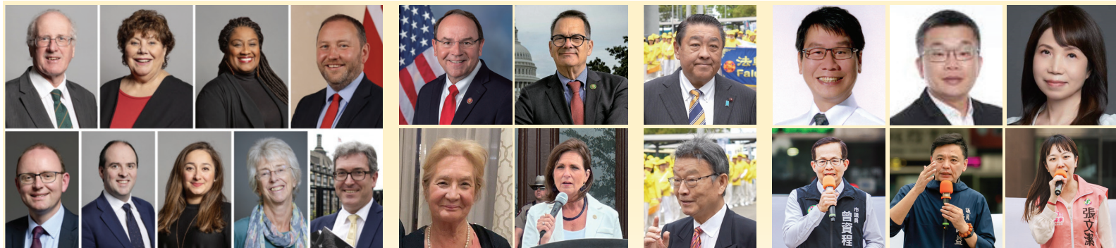
英国多位政要致函支持英国法轮功学员4.25反迫害活动