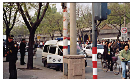
4.25当天中南海附近已驻有大量军警，还有专门录影的车在录影。

据公安部内部的人说，“四·二五”事发的前三天，公安部门已经掌握讯息并密切监控，却知情不报甘愿事后被批评。又据报道，事发后有人请求何祚庥发表评论，何说：目前不去评论，因为不想打乱整个部署（据5/5/99电子《明报》报道）。4.25当天科痞何祚庥在中南海西门里走来走去，妄图挑起学员们的的情绪，形成冲击中南海的局面。