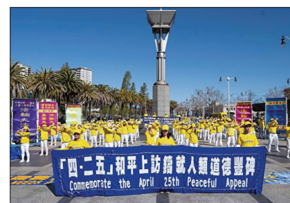
旧金山纪念“四·二五”集会

法轮大法已洪传世界一百多个国家和地区。在五大洲蓬勃发展，汇成一股强大的清流，“真、善、忍”之光不断的启迪人们的良知善念，指引世人回归的大道。历史证明闪烁真善忍光辉的“四·二五”是一块历史的丰碑，名垂青史、光耀寰宇！