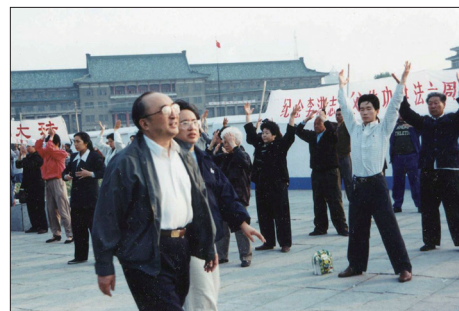
1998年5月15日CCTV1的《晚间新闻》和CCTV5同时报道国家体育总局局长伍绍祖视察长春群众修炼法轮功的盛况。

在此之前，国家体育总局也于1998年5月对法轮功进行全面调查了解。9月由医学专家组成的小组为配合此次调查，对广东12553名法轮功学员进行表格抽样调查，结果表明祛病健身总有效率97.9%。