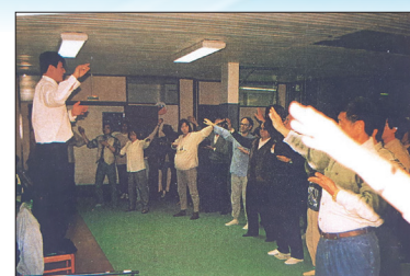
李洪志先生1995年3月在巴黎举办法轮功讲法班,在班上教功。

1996年10月12日在休士顿讲法,当天被休士顿市长宣布为“李洪志大师日”,并授予“荣誉市民”和“亲善大使”的称号,法轮功开始在世界各地洪传。