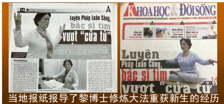
当地报纸报导了黎博士修炼大法重获新生的经历

五套功法，同时开始阅读《转法轮》，用“真善忍”的法理指导自己的行为。没过多久，她逐渐康复，感觉精神越来越好。随着修炼的持续，几十年的心脏病竟然在不知不觉间消失了。尽管植入了人工心脏瓣膜，竟然不需服用任何药物、抗凝剂等（常规医学上很难解释）。她可以健步行走了，上楼都很轻松，还能乘飞机去世界各地。虽然退休了，可她并没有完全脱离岗位，依然担任着行业的领先专家，需要时还可以熬夜。她说，我不仅恢复了健康，而且更自信、更开朗、活得更有希望。衷心感谢法轮大法，给了我第二次生命，给我生命中注入了新的活力！