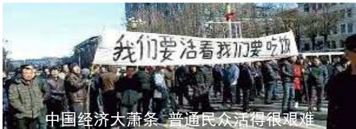
中国经济大萧条 普通民众活得很艰难

在失业率极高的大背景下，医院和医生也遭重创。多家医院倒闭后，拖欠医护人员大量薪资。多地医务人员纷纷反映，他们的疫情补贴迟迟未发。安徽一名医务人员在网络上发文称，她从未想过医院也会降薪潮，在疫情期间，自己和同事们连轴转，凌晨四点就要起床，如今补贴没着落，薪资不涨反降。江苏一网友爆料，临床一线医护的年终奖金被砍一半，只拿到行政部门的三分之一。据“医眼观察”去年的报导，自疫情爆发以来，超过 2 千家医院破产，这一数据仍在攀升中。一向被视为铁饭碗的医疗行业也难逃风险，显示出当局已经无力扭转形势，空谈 5% 的增长率，除了给自己脸上贴金，对民生没有任何实质意义，老百姓会依然活得很艰难。