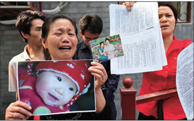
2008年9月中国爆发三聚氰胺毒奶粉事件，导致食用该奶粉的婴儿患上肾结石。照片中是一名不幸离世的宝宝。

在中国共产主义控制着国家，每个人从小学开始把唱《国际歌》作为课程“从来就没有甚么救世主，也不靠神仙皇帝”，把“旧世界打个落花流水”。在文化大革命中一场空前的浩劫将中国几千年来古籍、文物几乎摧毁殆尽。中国传统文化遭到前所未有的破坏，人们不再敬畏神明，在谎言、口号的洗脑中，变得行为粗鄙不堪，整个社会黄赌毒暴力泛滥、灾祸频发。