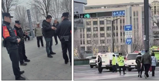
2025年中共两会正在北京召开，北京警察在大兴区检查站查身份证。