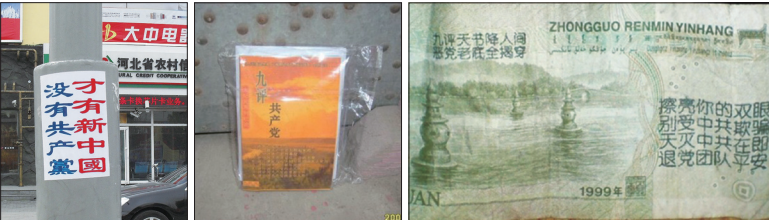
《九评》与三退讯息在中国遍地开花。左图起：湖北荆州古城旅游区真相标语；山西某小区放在住户门上的《九评》；人民币上书写三退讯息。

一个广州的男孩因家族被中共迫害，三退后主动要求做义工给家族的亲人三退，在两三年内搜集了近300个三退名