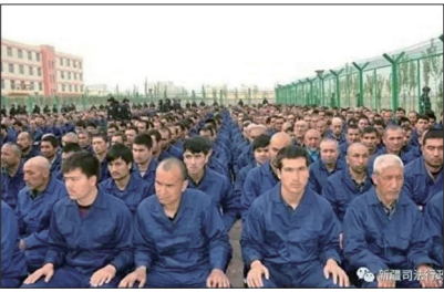
中共在新疆地区建立380座集中营，这些集中营还被分为4种监禁等级。