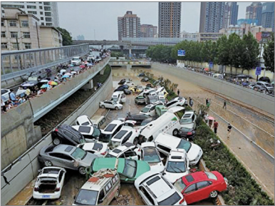
2021年7月河南郑州京广隧道口被洪水冲出的车辆堆叠在一起。