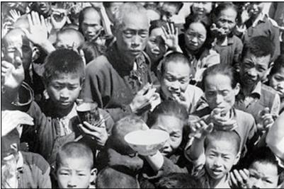
大饥荒导致超过四千万中国人非正常死亡。