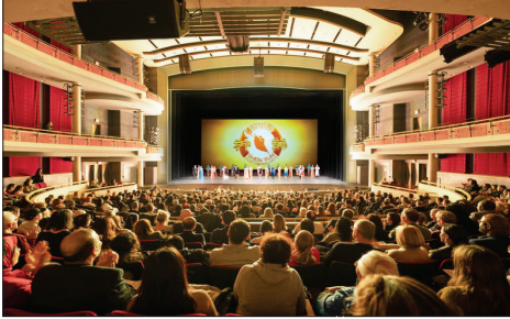
加拿大密西沙加表演艺术中心

中共两会期间各地纷传多位访民被绑架后失踪，也有访民被非法关押在警局或被软禁在家中，当局目地是不让访民在两会期间进京上访。北京动用数十万安保人员，戒备森严、风声鹤唳。全市进入维稳模式，警方的武装巡逻车实施24小时动态控制。内蒙古向访民挨家送“信访终结告知书”，上海则是监听民众电话，并将访民投入黑监狱。上海维权民众表示，两会期间与外界通话时不能谈及“上北京”，一旦被监听到，警察便马上上门维稳。异议人士宋嘉鸿向外界披露去年上海的黑监牢名录，收集到上海各区145家关押访民的黑牢处所及受害者被囚禁的时间（少则几天，多则80、90天）与责任单位。