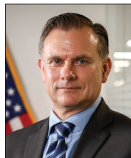
中国问题专家罗伯特·斯巴尔丁