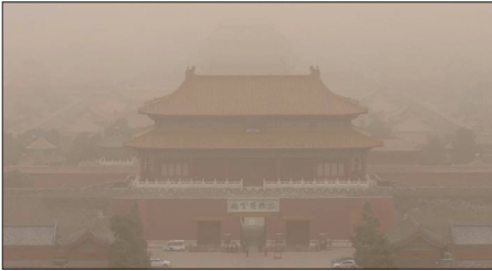
严重沙尘席卷北京