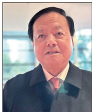
千叶县佐仓市原市长藏和雄