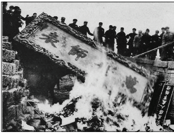
文化大革命孔庙中的“万世师表”匾被烧为灰烬。