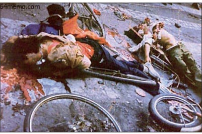
1989年6月4日中共装甲车冲进天安门广场“清场”，死伤无数。