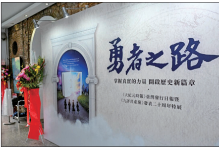
中华民国总统赖清德赠予《大纪元时报》勇者之路特展的花篮