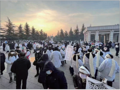
民众感染新冠死亡，各地殡仪馆大排长龙，西安殡仪馆外人山人海。