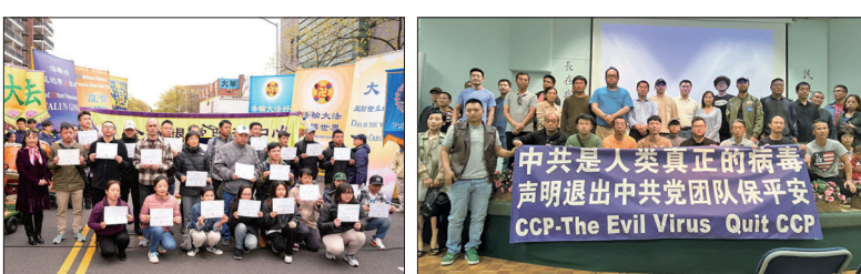
2024年4月21日有24位中国人在纽约纪念4.25集会上领取退党证书 2023年10月28日《四亿人的觉醒》在洛杉矶首映，三十餘名华人公开表示已三退。

美国国会众议院外交事务委员会人权小组委员会主席、资深国会议员克里斯托夫·史密斯表示，“我必须公开赞扬退党运动，赞扬中国人向前的勇气，以这样的行动将自由