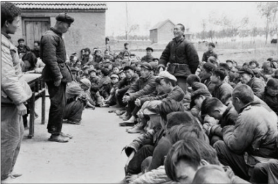
“四清运动”预演“文革”，逼死干部群众七万多人。