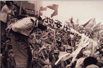
文革是一场浩劫，不仅彻底摧毁中华优秀传统文化，还戕害无数中国人。