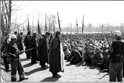
中共土改抢夺地主的房屋钱财，还通过斗地主剥夺人的尊严及夺取性命！