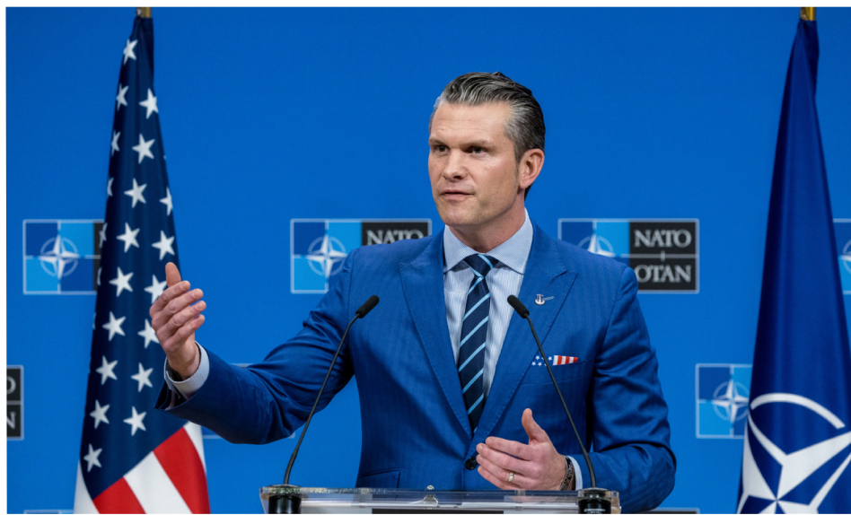
美中爆发新一轮贸易战，中共抛出威胁言语，美国国防部长赫格塞斯强硬回应。

而安洵公司与43个中共情报机构和警察局合作，每个被黑的邮箱收费1万至7.5万美元，多年来这家公司收入高达数千万美元。