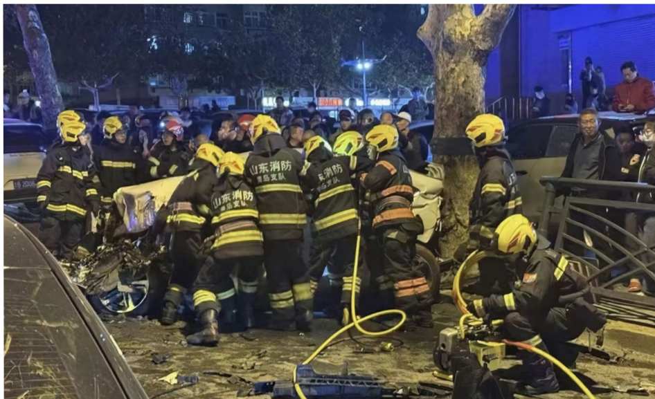
现场画面 - 山东青岛人民路10月23日晚发生连环撞车事故，酿成多人死伤。

种很强大的社会压力下，有些人会精神失常。而有些在生活中陷于困境的人，会在何时做出何种极端行动也无可预测。