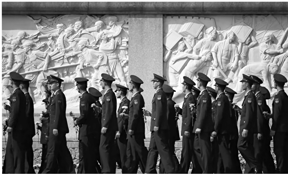
图为北京纪念碑前的中共军人。

近十几年来，大陆多地不断出现青年拒服兵役的情况。江西一名应届大专毕业生参军后中途退出，遭到严厉惩罚，其父母也受到牵连。有专家认为，中国年轻人拒服兵役的现象可能比外界所知更为严重。