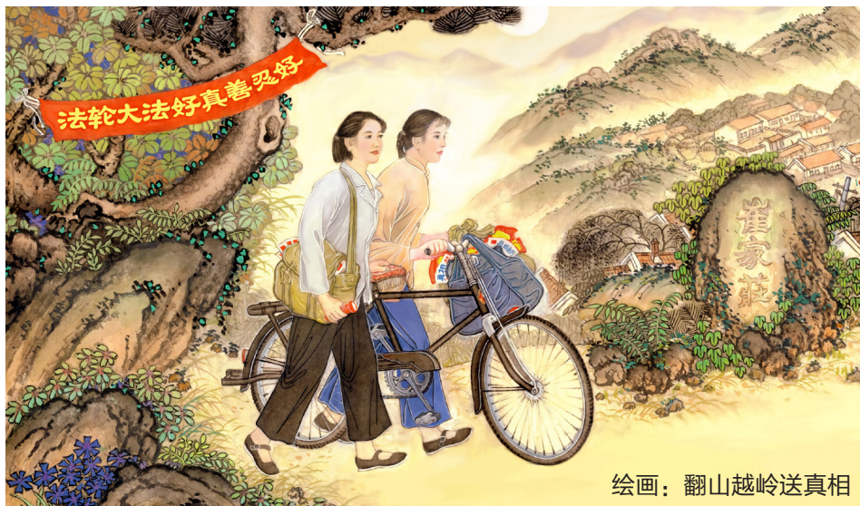
绘画：翻山越岭送真相

我抓紧时间转入讲真相的正题。我先和他讲了大法的一些基本真相，他认真地听着，最后我问他三退没有？他很认真地对我说：我知道法轮大法是好的，你们炼法轮功的人都是些好人，叫你们做坏事，就是给你们钱，相信你们都不会干的，如果全社会的人都象你们炼法轮功的人那样，社会的风气就会好了，也不可能会有这么多的天灾人祸了，中国打压这么一群善良的好人完全是