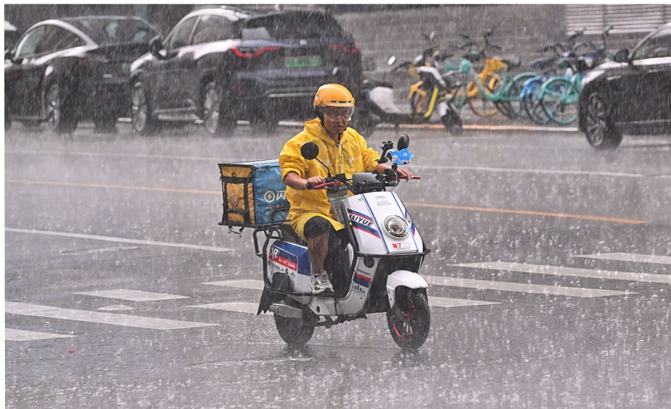
2024年8月10日，一名外卖员在北京的大雨中骑车送餐。

中国经济正在遭遇一系列的挫折，从旷日持久的房地产危机到内需疲软，导致外卖员的生计也遭受重创，社交媒体上爆出的爆炸性冲突事件此起彼伏，显示出这些人已经到了崩溃边缘。