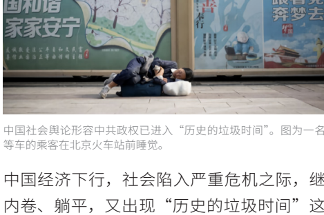
中国社会舆论形容中共政权已进入“历史的垃圾时间”。图为一名等车的乘客在北京火车站前睡觉。

中国经济下行，社会陷入严重危机之际，继内卷、躺平，又出现“历史的垃圾时间”这一流行词，引发官媒恐慌。