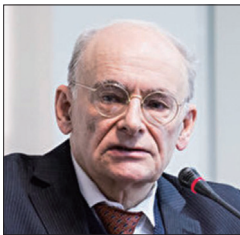
人权律师大卫·麦塔斯