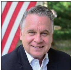
美国众议员克里斯托夫·史密斯