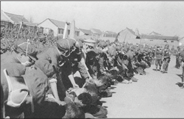
中共在镇反运动中对已经得到承诺既往不咎的投诚人员也大肆滥杀。

自1949年以来，中共利用镇反、土改、三反、五反、工商改造、取缔会道门、镇压宗教、大跃进导致的大饥荒、四清、文化大革命等一系列政治整人运动，导致八千万中国人非正常死亡，超过两次世界大战死亡人数的总和。