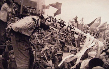
文革是一场浩劫，不仅彻底摧毁中华优秀传统文化，还戕害无数中国人。