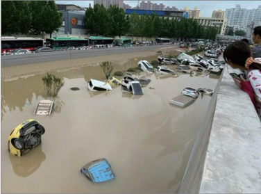
2021年7月河南多地水库泄洪，导致洪灾遍地。京广路隧道被洪水淹没，许多车辆惨遭灭顶。

2002年11月中共为稳定政权瞒报非典疫情，导致非典在全球爆发。2008年为保奥运，隐瞒川震预报与毒奶，造成重大伤亡和百万婴儿受害。2015年8月天津滨海新区开发区发生强烈爆炸，中共官方通报遇难者165人。民间估算及外媒报道认为死亡人数超过千人。中共中宣部并且要求大陆媒体统一口径，新闻发布会上中共宣传部官员也一问三不知。