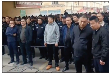
湖南长沙市雨花区高桥派出所的 大批警察和便衣与村民对峙

因为20年前高桥大市场扩建徵地拆迁引发的纠纷，湖南长沙市雨花区高桥村民维权已经持续很长时间，村民表示中间存在暗箱操作、官员贪污等情况。3月26日一位村民在维权过程中从楼上摔下死亡（具体地点不详）。28日当局调动大批警察抢尸体，引起民愤，上千村民冲砸派出所，派出所被砸得一片狼藉，警察被打得头破血流。该消息被当局全网封锁。