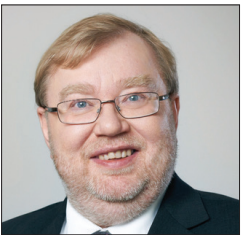
前爱沙尼亚总理马特·拉尔