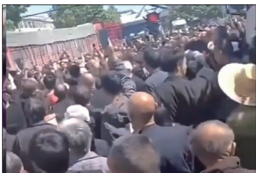
湖北随州广水市的长岭镇今年强推公墓，民众上街抗议。

湖北随州广水市当局要求自3月20日起，全区域所有居民死后必须火葬及购买公墓，遭到当地民众的强烈反对。五一期间连续三天，包括老人在内的数千人在该市长岭镇发起抗议活动，围堵公路，要求政府取消该政策。民众认为政府要求购买公墓，背后涉及腐败。甚至傳出3月20日以前当地很多老人自寻短见。