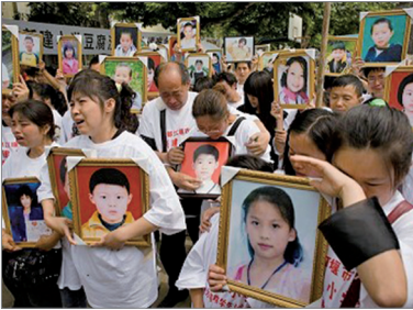
四川汶川地震中小学校舍倒下一片，被指豆腐渣工程，受难学生家长维权受到打压。