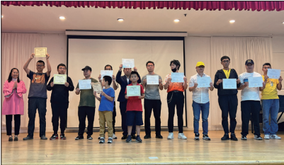
2023年9月17日纽约举办《四亿人的觉醒》首映会，13名观众现场三退。

领取退党证书。2012年6月9日在多伦多退党集会现场有21名华人领取三退证书。2018年4月22日纽约法轮功学员举行纪念4.25游行集会，18位华人公开三退。2021年4月18日纽约民众逾千人集会纪念4.25上访22周年，七位三退人士领取三退证书。6月26日上午加拿大退党服务中心在万锦市太古广场举行集会及汽车游行起步礼，有8位实名“三退”的大陆华人来到现场。2022年8月3日纽约集会庆祝三退人数突破四亿，8位华人在集会上公开退出中共党团队。2023年9月17日纽约举办《四亿人的觉醒》首映会，13名观众现场三退。