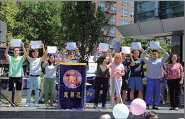
2022年8月3日纽约庆祝四亿人三退集会上有8人公开三退。

在全球各地纷纷举行声援中国勇士三退的活动中，很多海外华人在活动现场公开退党。例如2011年10月16日纽约曼哈顿举行庆祝一亿四百万人三退集会现场有41位中国人三退并