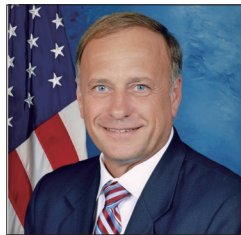
美联邦议员史蒂芬·金