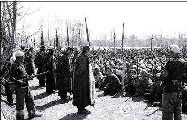
土改抢夺地主的房屋钱财，还通过斗地主剥夺人的尊严及夺取性命！