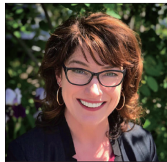
宾州州众议员玛丽·艾萨克森

用和平的退党方式，从灵魂上摆脱中共的精神控制，进而不给共产主义继续行恶的空间，用道德觉醒的方式来结束共产主义暴政，同时在正邪对比中又拯救每一个人的灵魂，所以“退党”无疑是赢得世界尊重的中国智慧。