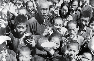
大饥荒导致超过四千万中国人非正常死亡。