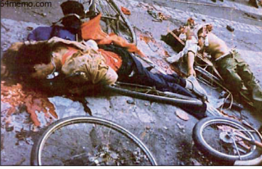
1989年6月4日中共装甲车冲进天安门广场“清场”，死伤无数。