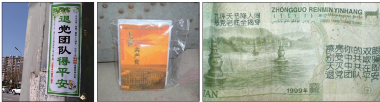
《九评》与三退讯息在中国遍地开花。左图起:河北廊坊街头的真相标语;山西某小区放在住户门上的《九评》;人民币上书写三退讯息。

在海内外退党义工努力下，明白真相的中国民众常常一人退党，带动全家和亲朋好友也退党，甚至主动帮助利用各种管道广传《九评》促三退，包括面对面劝退、互联网、传单光盘、短讯、语音、邮件等，还有在公共场所贴示横幅标语、在人民币上书写“天灭中共”等讯息，遍地开花。