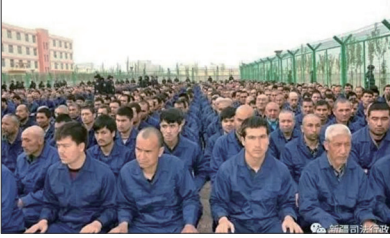
中共在新疆地区建立380座集中营，这些集中营还被分为4种监禁等级。