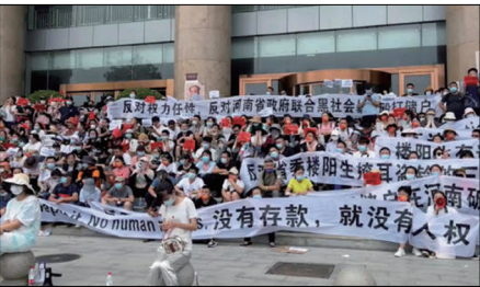
郑州3000多名群众在中国人民银行郑州支行外集结抗议，随后爆发警民流血冲突。

“江山易改、本性难移”。历史证明，中共每次放松枷锁和铁链，都并不意味着会放弃锁链。曾有学者研究，中国99%以上的群体事件是百姓利益受侵害引起。但维权的民众往往被冠以“动乱”、“暴徒”之名，遭当局严厉打压。