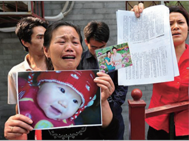
2009年毒奶粉受害者手举孙女遗照在北京卫生部前上访，控诉河南当地政府。