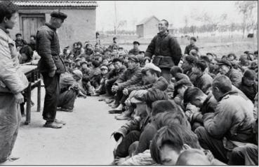
“四清运动”运动预演“文革”，逼死干部群众七万多人。