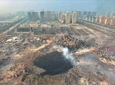
天津滨海新区危化品仓库大爆炸，进入火场的消防队员几乎全失联，实际死伤人数至今是谜。