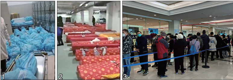
2022年12月初中共骤然放弃“清零”后，全国各大城市的医院里与火葬场尸体横陈，殡仪馆前大排长龙。图1:上海一个殡仪馆房间内满地是裹着蓝色袋子的尸体。图2:辽宁鞍山殡仪馆停车场变停尸场。图3:上海宝兴殡仪馆人们排队为已故亲属办理殡葬相关事宜。

中共镇压人民的理论基础是“稳定压倒一切”，“把一切不稳定因素消灭在萌芽状态”。中共从来不给人民任何实质性的良性互动管道，它唯一解决人民不满的方式就是群体屠杀。先以谎言骗取再以暴力登场，最后再以谎言掩饰。回顾中共执政历史，走的都是同一条路，丝毫没变过。未来，中共也绝不会因为改换了门面，而改变其邪恶本质。