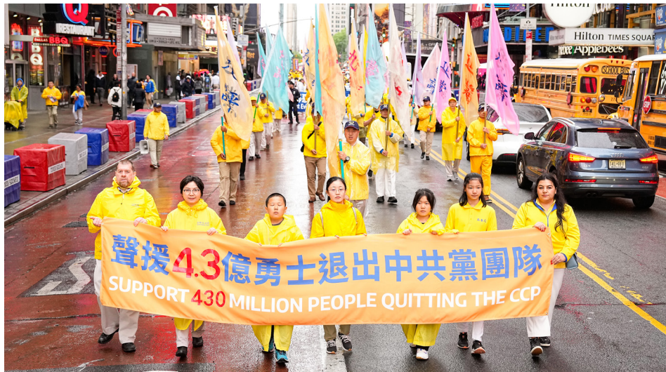
2024年5月10日，法轮功学员在曼哈顿举行大游行，庆祝世界法轮大法日。