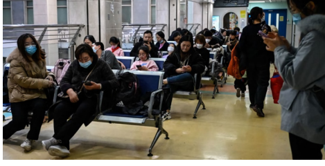
图为2023年11月23日，儿童和他们的父母在北京一家儿童医院的门诊区等候。

目前，“新冠”在中国网络上已经成了敏感词，很难在微博、百度搜索榜上搜索到相关信息。官方则以支原体、甲流、感冒等欺骗民众，混淆视听。