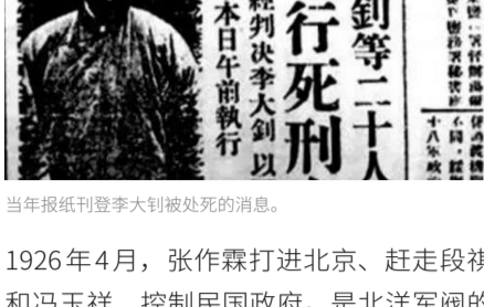
当年报纸刊登李大钊被处死的消息。

1926年4月，张作霖打进北京、赶走段祺瑞和冯玉祥、控制民国政府，是北洋军阀的一次内讧。这是教科书上说的。