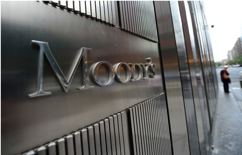
穆迪下调中共政府主权信用等级。

12月5日，穆迪先将中国主权信用评级展望从“稳定”下调至“负面”，并警告中共地方政府的债务风险、房地产行业危机等正在加深。