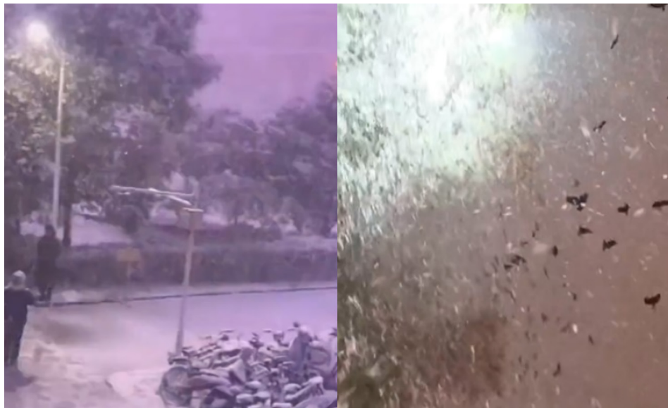
2023年12月10日晚，河南省多地遭遇暴雪袭击，惊现“雷打雪”异象。郑州大群乌鸦在暴雪中狂飞，场面诡异。

12月10日，河南省多地遭遇暴雪袭击，惊现“雷打雪”异象，伴随着紫色的闪电。郑州则罕见出现大群乌鸦在暴雪中狂飞的诡异场景。这些不祥的异象，令网友感到惶恐：“不知道2024年会出现啥事！”