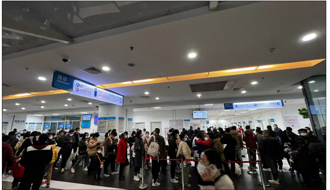
12月5日的上海儿童医院。

自11月以来，北京、上海、天津、江苏等地疫情再度升温，各大医院都爆满，深夜的急诊处灯火通明，患者大排长龙。这波疫情高峰已经持续一个多月，依然不见减缓的迹象。