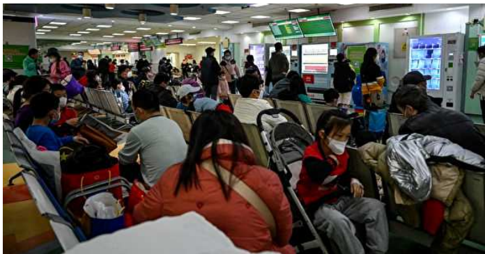
北京市的医院儿科门诊挤满了家长与儿童

中国当前爆发新一轮不明肺炎，官方称是“支原体肺炎”，而外界普遍质疑，是否新冠病毒出现了新变种。这次孩童是重灾区，儿童医院人满为患。天津、北京有些医院及首都儿科研究所一天要接诊近万例，已不堪负荷。北京的北大妇儿医院更是重启了方舱，说是要当作临时输液室，但是接下来方舱会不会变成隔离区呢？会不会有更多的方舱医院重启呢？河北某市再次出动“大白”上街消毒了，这一切太熟悉了，仿佛三