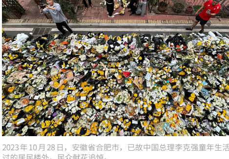
2023年10月28日，安徽省合肥市，已故中国总理李克强童年生活过的居民楼外，民众献花追悼。

中共党媒宣布李克强10月27日凌晨过世后，中国各个社交平台对相关讨论严格审查，并关闭评论区，相关的关键词也被封杀。