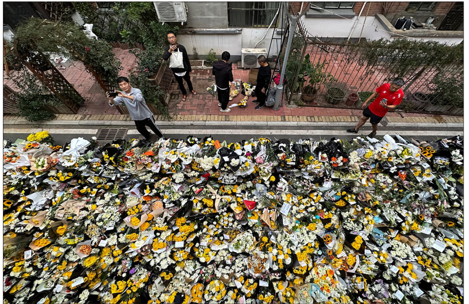
2023年10月28日，安徽省合肥市，已故中国总理李克强童年生活过的居民楼外，民众献花追悼。

往李克强故居祭奠，并不是说对李克强有多怀念。而是借着这个机会，表达一些对生活不如意、工作不如意等不满的情绪。”