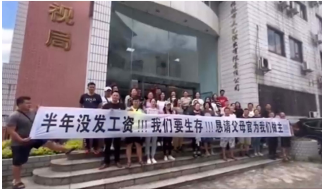
9月5日，一则讨薪视频在网络热传，视频中数十人手举白底黑字横幅抗议。（视频截图）

中共高压统治之下、加上三年疫情的强制防控，导致中国经济急剧恶化，大企业、房地产行业接连爆雷，外资出逃，青年失业率飙升，地方政府除了发债及向上级要钱，财政收入大幅减少，各地出现公务员降薪潮。