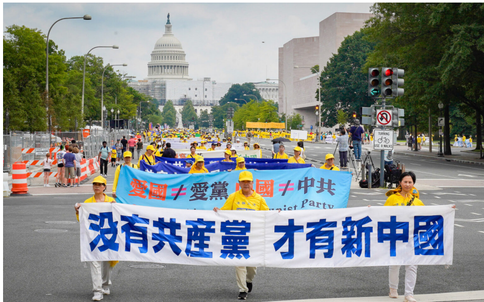
2023年7月20日，美国首都华盛顿DC举行大游行，抗议中共过去24年来对法轮功团体的残酷迫害，声援超过4亿人声明退出中共党团组织。

自2004年11月18日大纪元发表社论《九评共产党》以来，许多中国民众认清了中共的邪恶本质，每天都有大量民众在退党网站发表声明退出曾经加入过的中共党、团、队组织（简称“三退”）。截至2023年10月底，共有4亿2115万人声明三退。其中，今年1—10月，声明人数1332.68万人，比上年同期增加8.86万人。