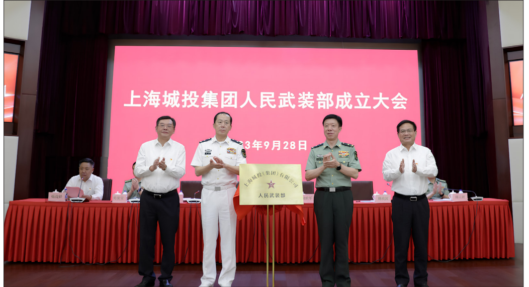
9月28日，上海城投集团成立武装部。

近日，上海城投集团以“加强国防后备力量建设”的名义，成立了一个由上海警备区直管的武装部。消息经媒体披露出来后，引起网上舆论的关注。网民们因此生发出各种揣测与感慨，有人惊呼：在为军管做准备？