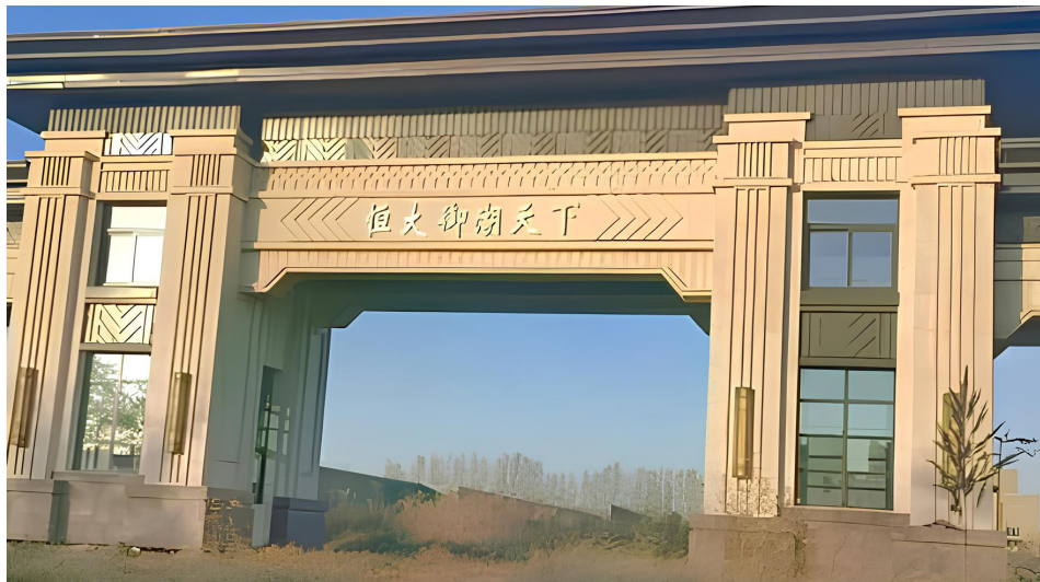
被称为地产界最牛“烂尾楼”的恒大御湖天下项目，整个项目只修建了一个大门。

恒大创始人许家印涉嫌犯罪已被“采取强制措施”，还有部分恒大高管被带走调查，标志着恒大的爆雷已进入高潮。而遭受该事件强烈冲击的，除了握有恒大股票或债券的投资人外，还有购买了恒大烂尾楼的广大业主们。