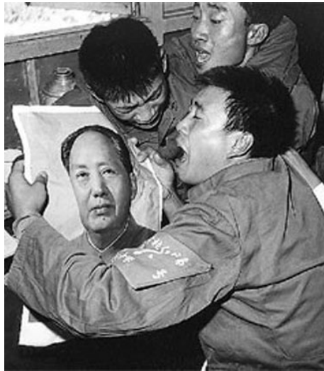
青年们手捧毛泽东像。

“人生七十古来稀”，我八十多了，人老总想后事，中国有句古话叫盖棺定论，我虽未盖棺也快了，总可以定论吧！我一生干了两件事，一是与蒋介石斗了那么几十年，把他赶到那么几个海岛上去，抗战八年，把日本人请回老家去了。对这些事持异议的人不多，只有那么几个人，在我耳边叽叽喳喳。无非是我没有及早收回那几个海岛罢了。另一件事你们都知道，就是发动文化大革命。这事拥护的人不多，反对