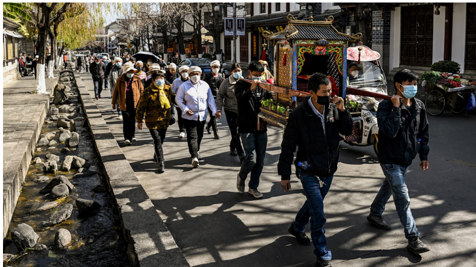
中国疫情期间的殡葬队伍。