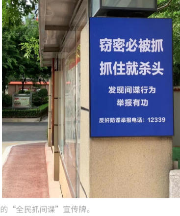
中共搞的“全民抓间谍”宣传牌。

外教能有多谨慎 开学第一课的介绍 我是美国人 我不是间谍 哈哈哈哈哈 #外教 # 今天 05:48 上海 上海一高校外教上课时首先自证清白。