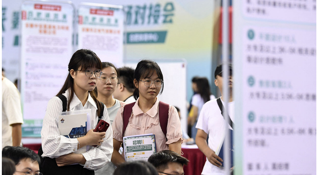
2023年9月4日，安徽省合肥市高校毕业生招聘会。

中国国家统计局公布的数据显示，8月份，中国全国城镇调查失业率为5.2%，比上月下降0.1个百分点，低于上年同期，与疫情前2019年同期持平。