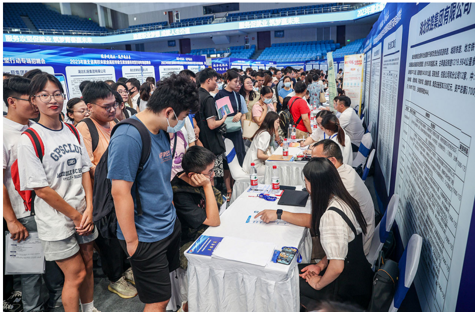
2023年8月10日，大学毕业生参加在中国中部湖北省武汉市举行的招聘会。

今年1至6月，中共公布的青年失业率数据逐月攀升，从1月的17.3%一路升到了6月的21.3%。今年8月15日，中共不再公布这一数据。而北大学者张丹丹则曾在近日发文指出，今年3月中国青年失业率最大值为46.5%，远高于官方公布的数字。