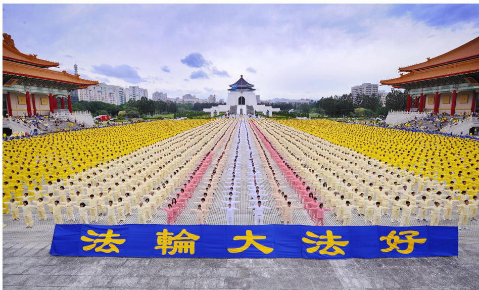
2011年11月26日，多国法轮功学员在中正纪念堂前炼功，场面壮观宏大。

一天吃午饭，一根鱼刺卡在我婆母的喉咙里，怎么咳也出不来。怎么办？丈夫急的去找大夫，回来说：诊所大夫治不了，只有去医院了。我说：妈，咱们一起念“法轮大法好，真善忍好”。我发完正念求师父，不一会儿，婆母咳了一声，鱼刺出来了。当时，我们全家人都见证了法轮大法的神奇与超常，谢谢师尊、谢谢大法。