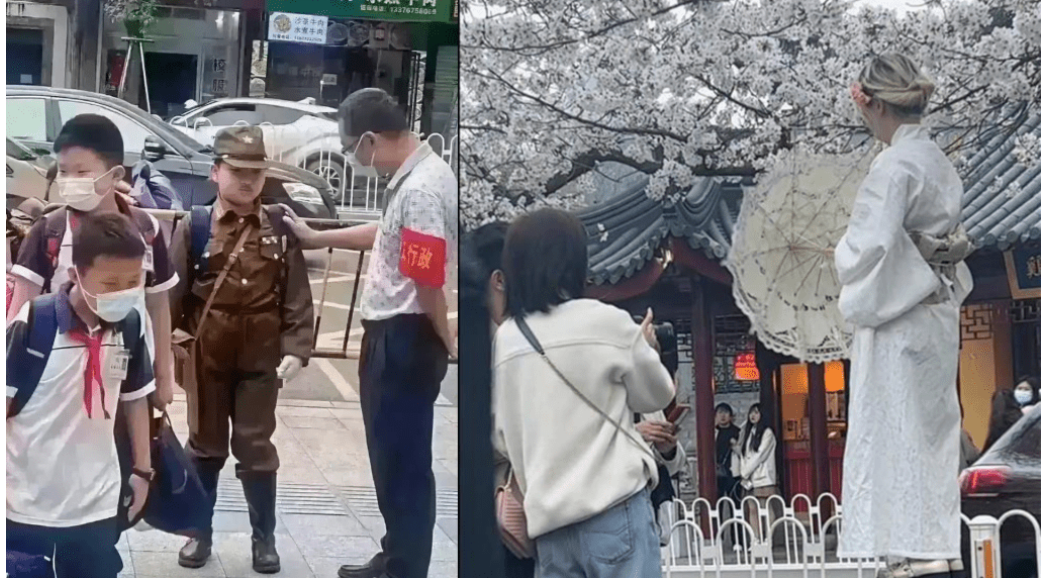
中共修法禁“伤害民族感情服饰”征询公众意见，网民热议。

中共全国人大常委会日前审议并公布的《治安管理处罚法(修订草案)》引发争议。其条款中规定“穿着有损中华民族精神、伤害中华民族感情的服饰、标志”和“制作，传播，宣扬，散布有损中华民族精神、伤害中华民族感情的物品或言论”将被处以罚款和拘留。