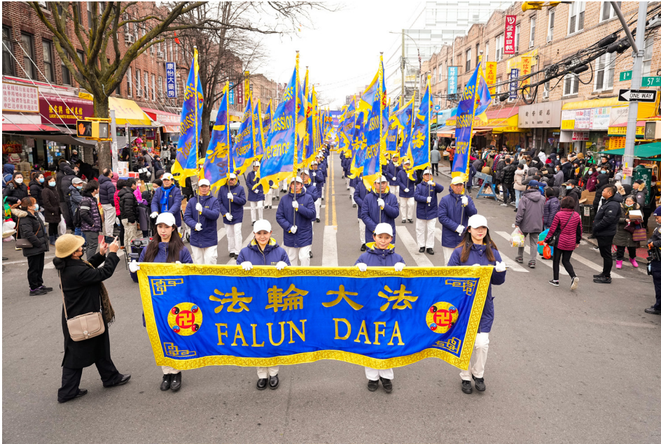
法轮功纽约游行，民众赞正向能量十足。

我今年70岁了，是退休工。修炼前，身体不好，患胃病、神经衰弱、颈椎病，手都是麻的，给自己的生活、工作造成了很大的困扰，因此精神压抑，沉闷不乐。40多岁的人，看上去很老相。在1997年修炼法轮大法后，身体的各种疾病都好了，身体一身轻，精神愉悦。下面说说家人相信法轮大法真善忍好，得福报的几个片段。