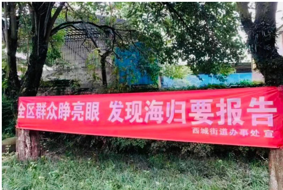
北京西城区街道办事处号召全民抓间谍的横幅

目前，中共正进行大规模反间谍宣传，并鼓励民众互相举报间谍特务，搞得人人自危，凸显中共内部危机重重。有消息说，一名做手机贴膜的小贩，称他贴膜几个月，就抓了三个间谍。