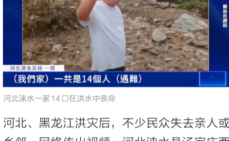
河北涑水一家14口在洪水中丧命

河北、黑龙江洪灾后，不少民众失去亲人或乡邻。网络传出视频，河北涑水县汤家庄西塌村村民诉说洪灾之后家乡的惨状。