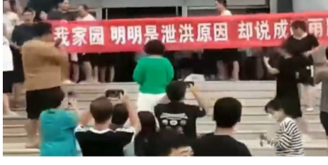
由于不满官媒宣称是降雨导致淹水，河北省霸州市因泄洪而家园尽毁的愤怒灾民，8月4日到霸州市政府高举横幅抗议，并与在场警察爆发激烈肢体冲突。

8月4日，央视网题为《河北霸州：降雨致部分村庄淹没被困人员被全部转移》的报导，称霸州市遭洪水淹没是“受降雨影响所致”。央视新闻也播报了这条新闻。这条新闻让饱受洪水围困的民众怒火冲天。8月5日，霸州市东杨庄乡上千村民前往政府大楼抗议，他们在现场打出“还我家园，明明是泄洪原因，却说降雨所致”的横幅抗议。