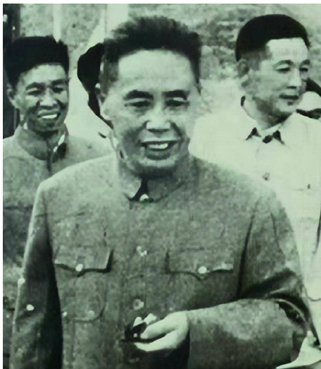
1973年公安部长李震意外身亡

斯大林把江青裸照（复制品）交给中共后，当时中共仅政治局常委中几个核心人物见到这张照