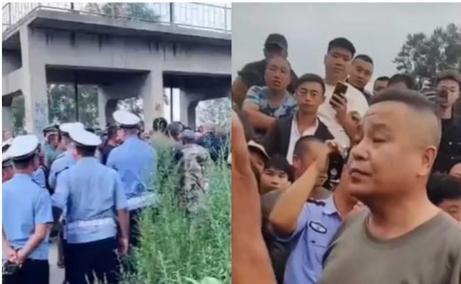
2023年8月5日，哈尔滨双城区因泄洪发生警民对峙。

中共政府牺牲农村保城市的做法，引发广泛地舆论批评：“凭啥让老百姓做护城河。”“为什么不远处那个新区一点事都没有，‘水往穷处流’。”“双城要是地也