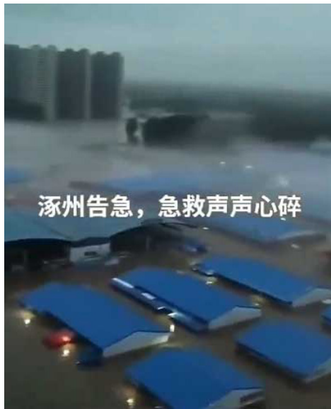
涿州告急，急救声声心碎