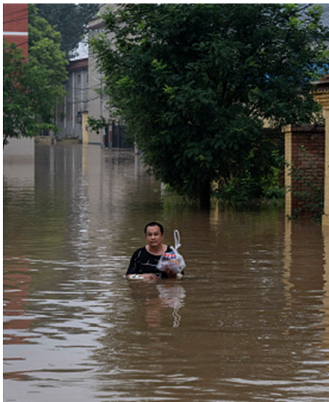
左：涿州的房屋淹在洪水中；右：2023年8月3日，涿州一灾民泡在水中。

日前，一名获救的涿州灾民发布视频，讲述为什么当地老百姓没有提前撤离。她在视频中说，因为大队书记没有说撤离，而是让村民们上二楼等候，等到水深到两三米已经跑不了的时候，才被通知撤离，这时已经走不了，都被困住了。