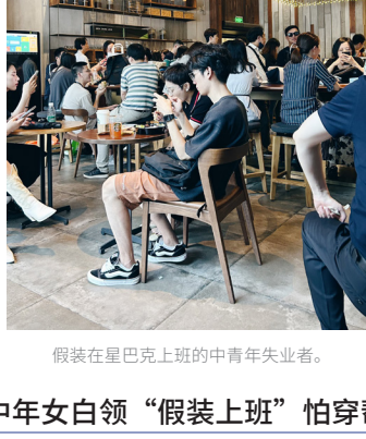
假装在星巴克上班的中青年失业者。