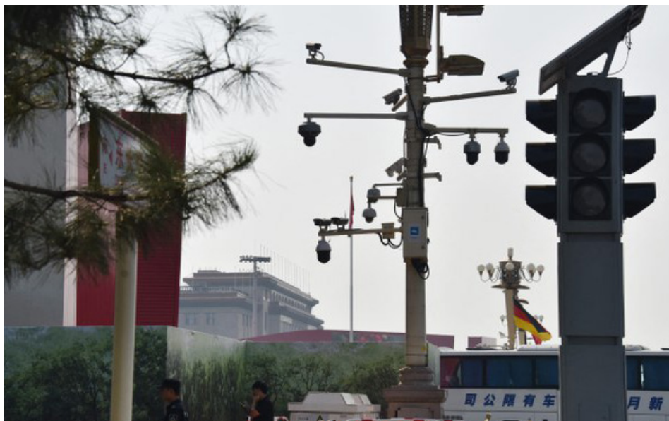
中共对中国人的监控无所不在，图为北京天安门广场一角的监控摄像头。

此事引发微博网友热议，话题冲上微博热搜。有网友说，“我笑不出来，太吓人了。”“细思极恐。”“我看完背后发凉，之前别人说聊天信息被JK（监控）我还不相信。”“我也觉得恐怖，真就离谱，说什么做什么转给谁都看着你呢”，“真的，感觉就是赤裸裸地被人全部监控。”“我也是……这热搜看得我浑身不适，最大的问题在于大家的态度……侵犯公民隐私权还很理所当然的样子。突然就联想到《1984》的情节，‘老大哥’在看着你。”“太恐怖，一