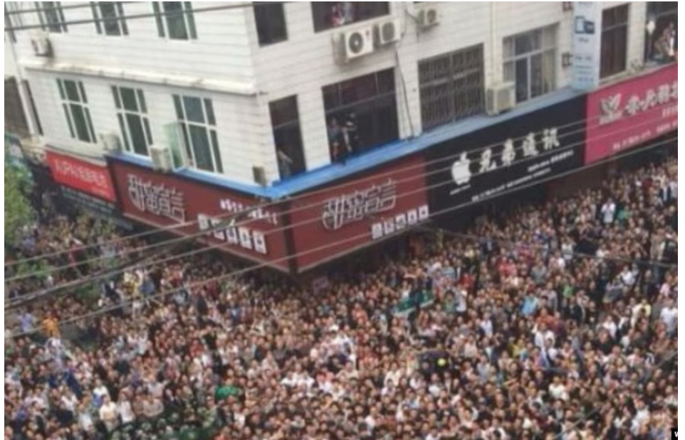
苍南县数千民众将打人城管围困在车中。

人在过去两年就收到了高达27.5万元的罚单。他们的货车明明在出发前都没有超重，但半路被拦下检验时都变成过磅超重而吃下罚单。去年山西省一家杂货店因为卖了2.5公斤不合格的芹菜，被重罚6.6万人民币。去年8月，广东省还发生官员假造证据，处罚卡车司机非法倾倒垃圾。