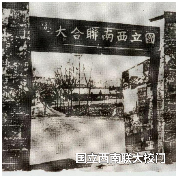
国立西南联大校门

《教育宪法》规定：“边远及贫瘠地区之教育文化经费，由国库补助之。其重要之教育文化事业，得由中央办理或补助之。”“教育、科学、文化之经费，在中央不得少于其预算总额15%，在省不得少于其预算总额25%，在市、县不得少于其预算总额35%，其依法设置之教育文化基金及产业，应予保障。”业内人士可以对照60年前的这个标准算今天的帐，看看有没有差距。