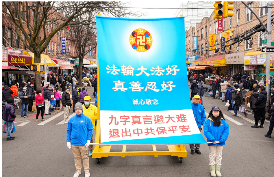
2023年2月26日，美国法轮功学员在布鲁克林举行大游行。

公安局长的儿媳妇，刚好她的女儿与小孙女儿也非常好。我的小孙女儿和她女儿一起玩儿，她女儿毫不吝惜，甚么东西都给我小孙女儿。公安局长的儿媳妇说：“真不可思议，我女儿非常‘小店儿’（吝啬的意思），她姥爷给个名字叫‘小抠儿’，她的东西连她爸爸也别想要出来，可是你家丫丫要，她那么痛快。”