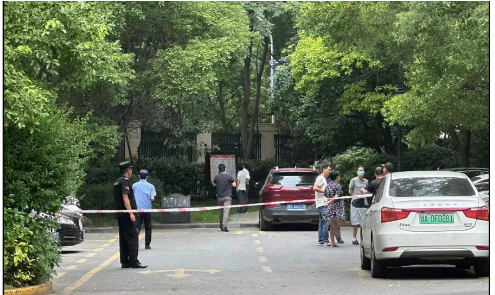
武汉多位市民说，被撞死的学生母亲坠落身亡，是受到“国保”维稳威胁。

6月2日，据官媒央广网报导，“小学生校内被撞身亡”事件中孩子的母亲在小区内坠楼身亡。此