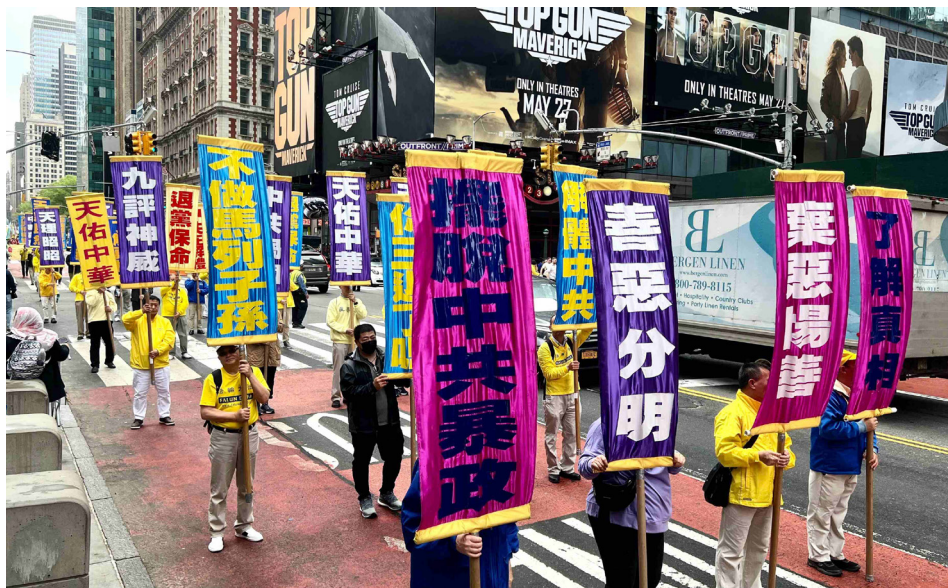
2023年5月12日，纽约法轮功学员在曼哈顿举办盛大游行，呼吁中国人“三退”。

“我在生活中有限接触过的法轮功学员都很和善，在邪党的阴影笼罩下仍然坚持良知普及真相，