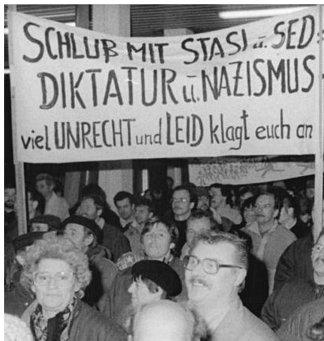
冲进柏林史塔西总部的东德示威者。

正式雇员多达17.4万名。加上被胁迫参与监视的告密者，参与史塔西工作的总人数在60万以上。