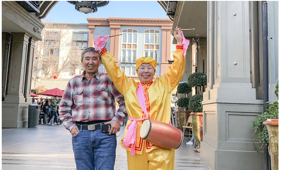
曾经的家暴男，现在是妻子的好帮手。

更多真相，请翻墙访问 法轮大法明慧网 www.minghui.org 大纪元 www.epochtimes.com 干净世界 www.ganjingworld.com