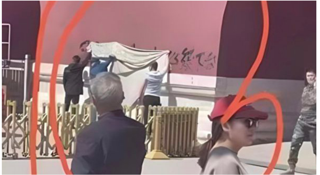
天安门红墙被喷字“共产党必须下台”。

日前，有人在天安门红墙上喷字：习近平共产党必须下台，引发关注。推特上网友纷纷转发并盛赞：向勇士致敬！这是继去年彭立发在北京四通桥抗议中共当局，并引发厕所革命、白纸革命后，中国民众抗议中共暴政的又一次行动。