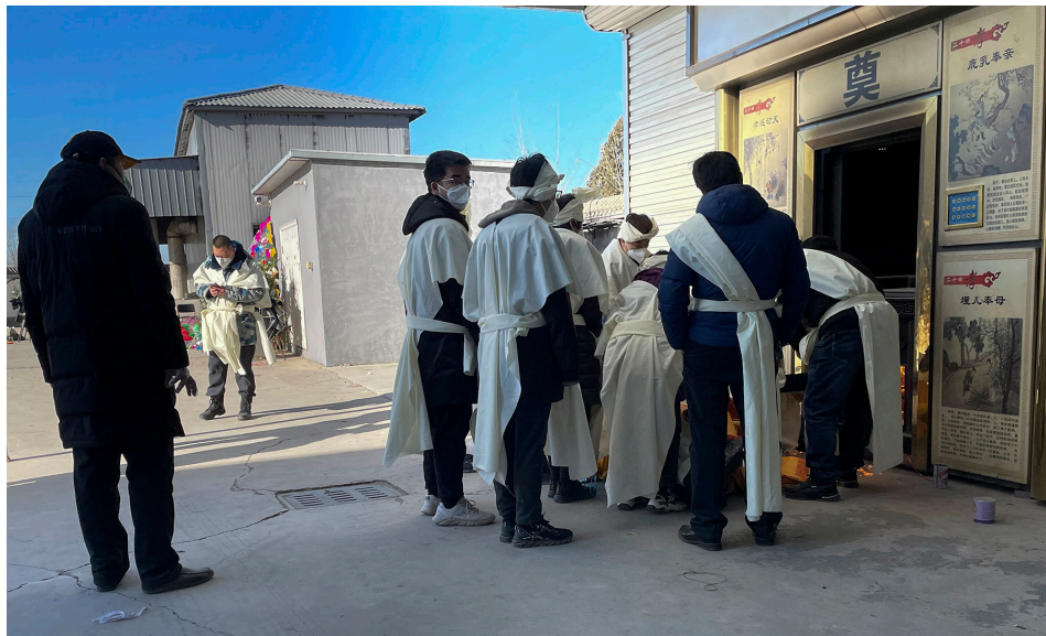
2022年12月22日，亲友在河北高碑店殡仪馆外焚烧纸钱，祭奠去世亲人。

三年多来，山东邹城遭疫情重创。一名警察在疫情真相和身边恶报事实面前，终于幡然醒悟，向外界披露了当地的疫情数据。