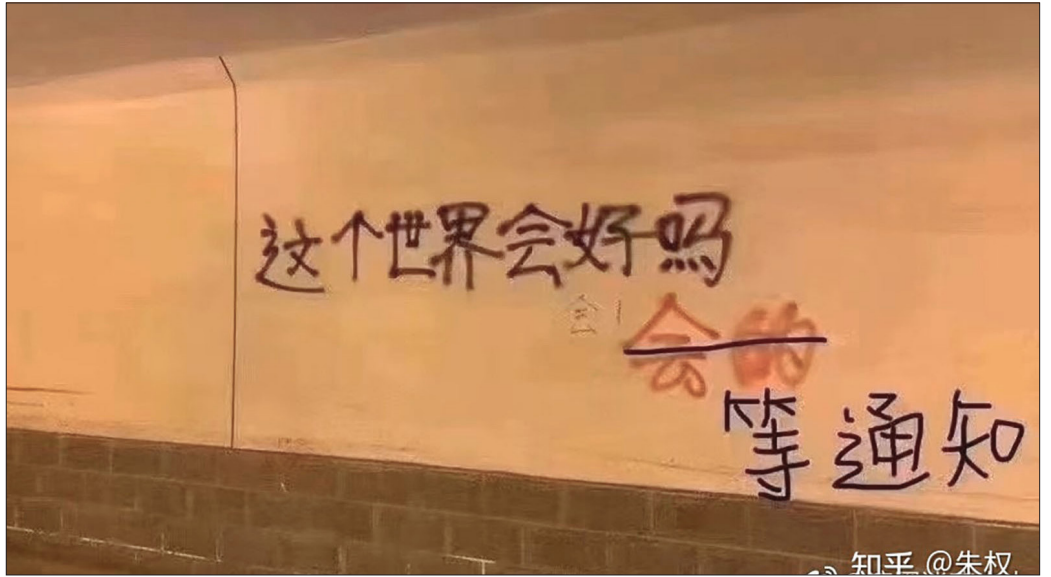
知乎：社会越来越好吗？答：人快成待下锅的菜。

中国制造业之都东莞，因为接不到外销订单，工厂招工量大幅减少，很多人找不到工作，吃饭都成问题，近日传出有人饿死和饿晕街头。