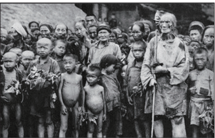
在大饥荒时期几千万中国民众被饿死

红旗出版社1994年2月出版《中华人民共和国历史纪实》一书，在“大饥荒”一文中说“1959年至1961年的非正常死亡和减少出生人口数，大约在4千万人左右。”这场大饥荒