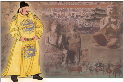
唐太宗在位期间崇善广德，恩泽四方，成就历史上最辉煌的“贞观之治”。

在中华五千年的历史中，不乏仁政的实施者：古有尧舜、周具文武、汉出文景、唐盛贞观、清泰康乾。仁政特点在于选贤用能、广开言路、讲义求睦、博施于民而能济。历代仁政都把“爱民”、“富民”、“教民”视为政府的基本职责。老百姓循礼守法，安居乐业。