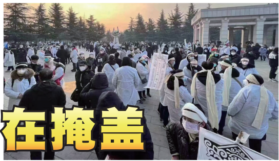
西安殡仪馆外人山人海

2022年12月初中共骤然放弃“清零”后，彻底放开让民众“应阳尽阳”，与此同时，全国范围内迎来了自武汉肺炎（中共病毒）爆发以来最大的疫情海啸。中共极力掩盖，发布的疫情数据难以自圆其谎。