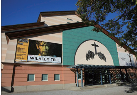
德国巴伐利亚的欧伯阿梅高上演《耶稣受难剧》的剧场。

当年黑死病在德国肆虐时，巴伐利亚的欧伯阿梅高村庄的村民全跪下来向神祈祷，承诺如能幸免于难，他们将以上演舞剧《耶稣受难剧》的形式予以回报和感恩，随即黑死病销声匿迹。