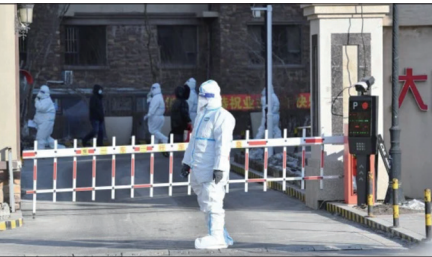
吉林一小区因一例无症状感染被封

因为在极端封控中，人与人之间的联系几乎被切断，外面到底发生了什么，被隔离的人是很难得知的。中共用铁腕强行打乱社区联系，有的人在方舱里死了就被拉走了，甚至有的还没死就被拉走了，到底拉到哪去了人们也不得而知。