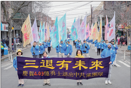
纽约游行声援四亿人三退

古语说：“君子不立于危墙之下”。衷心希望对中共仍然抱有幻想的人们幡然醒悟，在这千钧一发的历史决定性时刻声明三退，不做中共邪党的陪葬品，为自己选择一个美好的未来！