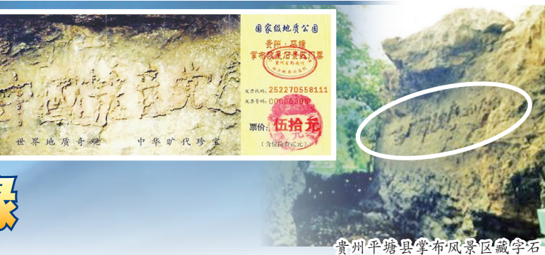
贵州平塘县掌布风景区藏字石

柏林墙的经验告诉人们，无论多么强大的堡垒都可能在瞬间崩溃；不管多么严密的铁幕都抵挡不住命运从容的巨手。旅居荷兰的时政评论人立里指出，苏联共产帝国直到崩溃前一刻，人们一直都没预料到，还以为它会长期维持稳定存在下去。所有专制帝国的崩溃都是重复这样的故事；没有崩