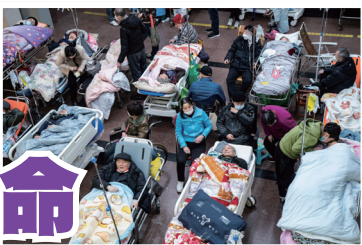
上海一家医院的大厅挤满病患