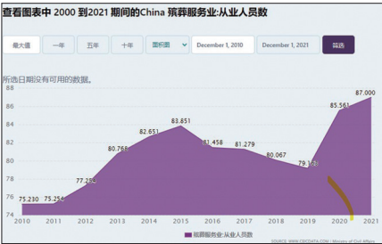
中国殡葬业从业人员数暴增

美国的艾伦先生关于新冠以来死亡人数的分析和推测指出，从民政局发布的火化炉的数量和殡葬行业从业人员的数量推理，中国殡葬行业从业人员数量，从2015–2019年递减4688人；火化炉的数量从2018–2019年减少，但从2019–2020年却开始暴涨，一年时间就超过2015年的高峰。中国2020年初火化率为55.7%，2020年全国死亡人数应该在8674.7万人。按他的估计，加上2021年的8743.8万，2022年 1.7亿，和2019年的死亡人数，总体上会有超过4亿人死亡。