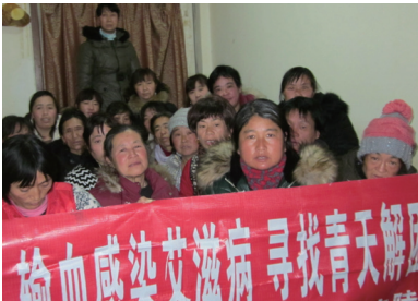
输血感染爱滋病的受害者到北京上访

在80年代到90年代河南出现爱滋病，但中共说爱滋病是外国人的病，中国没有。当时河南许多输血站，把血浆提取后将其它的血液成份汇集在一起回输给献血者，说是使他们能更快地恢复并能尽快献下一次血。为节省开支，针头重复使用，导致100万人得爱滋病。