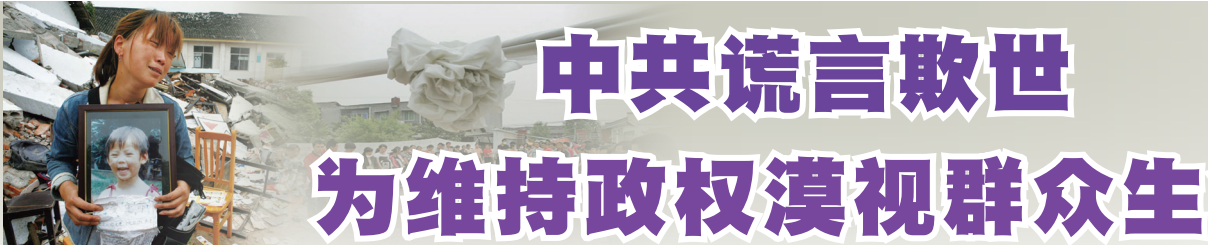
汶川大地震中死去孩子的母亲

自新冠病毒大流行以来，在中共极端防疫“清零政策”下，全国各地动辄封城、封区、封门，导致层出不穷的各种次生灾害、经济遭到重挫，人们无法维持正常生活，丧失行动自由。三年里中共把整个中国变成一座没有围墙的大监狱。中国民众对中共残酷、毫无人性，以清零为目标的变态防疫政策感到不满、窒息、绝望和愤怒。