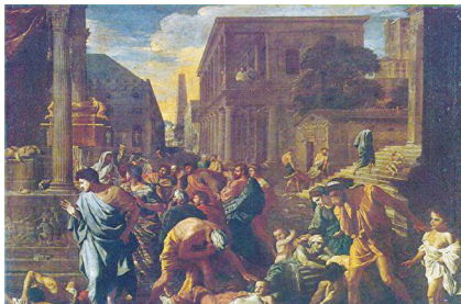
名画《阿什杜德的瘟疫》真实描述公元二世纪中叶，古罗马安东尼大帝执政时期，突然爆发的“安东尼瘟疫”。

据不完全统计自上个世纪90年代，前苏联以及东欧共产主义全面解体之前，死于共产主义受难者的人数已经超过上亿人，比两次世界大战死亡人数的总合还要多。20世纪晚期，东欧各国有如骨牌效应般纷纷抛弃共产主义，迈向自由。