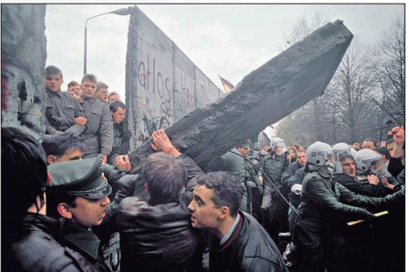
1989年11月9日柏林围墙倒下，数以千计的东柏林人欢庆他们终于脱离共产主义这个大劳营。

溃前，看起来总是强大无比威风八面。他说，独裁政权的基础就是谎言和暴力，民众早就明白一切都是假的，只是为了眼前利益而顺从暴政，它早就丧失继续存在的根本道德基础，因此其崩溃也是必然的。