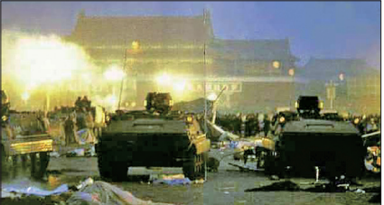
1989年6月4日中共军队出动坦克屠杀爱国学生及北京市民，震惊全球。

1989年六四天安门民主运动起端于对胡耀邦的悼念活动，学生透过悼念要求民主自由。中共军队出动坦克武力镇压，