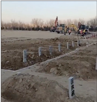
2023年1月3日网友披露，北京郊区挖掘机正在开挖大量土葬的回民的新坟。

就在大纪元报道疫情死亡数字真相的第二天，1月17日中共国家统计局罕见公布，去年中国人口自1961年以来首次出现下降。反常的是中共对于大纪元揭示出的疫情真相既不敢承认，又不敢反驳，罕见地保持了沉默。而背地里中共却加大掩盖疫情、打压真相的力度，比如用普通车辆代替灵车来运送尸体，以掩人耳目，并且收紧了网络审查。