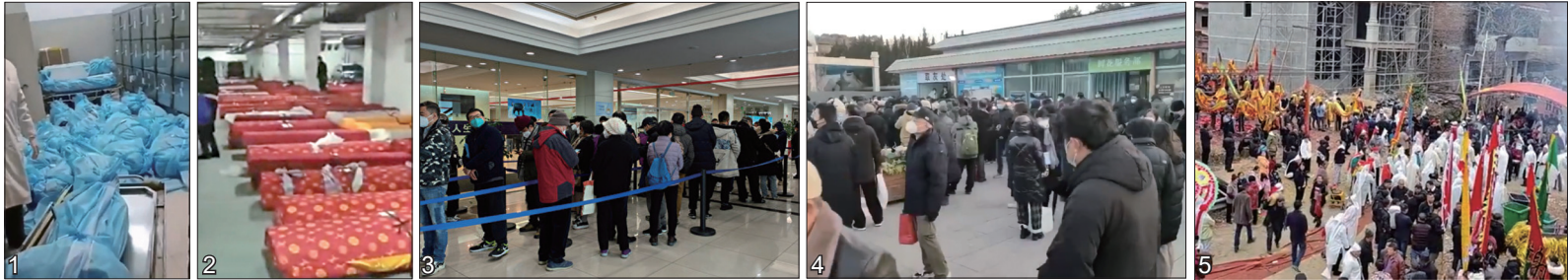
图1:上海一个殡仪馆房间内满地是裹着蓝色袋子的尸体。图2:辽宁鞍山殡仪馆停车场变停尸场。图3:上海宝兴殡仪馆人们排队为已故亲属办理殡葬相关事宜。图4:北京八宝山殡仪馆前领取骨灰的家属人山人海。图5:邵阳邵东市街上同时有8条送葬队伍。