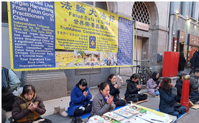
英国伦敦唐人街法轮功真相点

2023年1月21日除夕和大年初一，伦敦唐人街涌入大批民众体验中国新年的气氛。法轮功学员如以往在唐人街的固定景点讲真相及征签。学员们轮番在现场展示功法、发正念、递传单和讲真相，民众驻足围观并询问索取法轮功资料。不少人过去听说过法轮功在中国受迫害、中共活摘器官的罪行。人们纷纷停下来了解真相并签名支持反迫害。