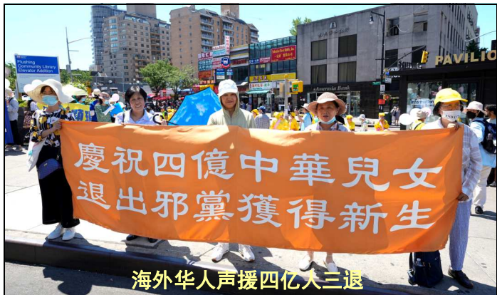
海外华人声援四亿大三退

面对全国疫情海啸般肆虐，死亡率剧增，医院、火葬场崩溃，尤其一批批中共官员或为中共站台的名人、专家扎堆死亡，众多民众幡然醒悟，意识到瘟疫长眼、是冲着中共而来的，想远离灾厄必须远离邪党！人们纷纷通过各种渠道在海外退党网声明退出中共的党、团、队组织。