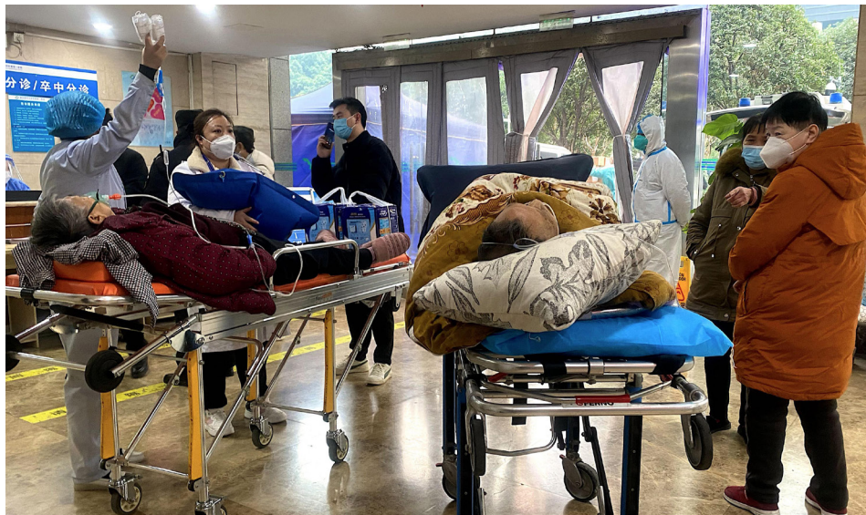
图为急诊室病患。染疫人口爆增，北京市疾控中心却召开疫情工作“表彰大会”。

1月13日，北京市疾控中心召开了三年防控工作总结表彰大会，称“三年来中心在疫情防控、大型活动保障等各项工作中均取得了出色的成绩，稳步推进首都疾控体系建设迈上新台阶。”