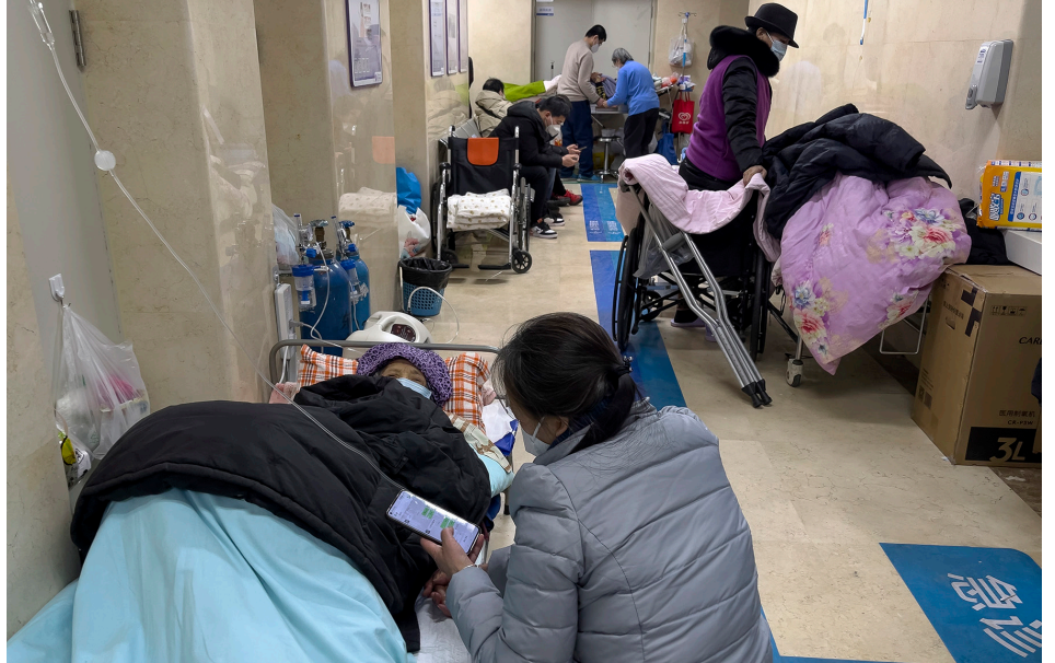
2023年1月3日，患者在北京一家医院急诊病房外等待就诊。

近年来，中国的人口普查数据饱受外界质疑。例如，2021年12月，国际知名人口学家易富贤估计，中国2020年人口是12.8亿，而不是官方人口普查数据所说的14.1亿。2021年8月有报导指日本人利用食盐的消耗量，估计中国人口在过去十几年大幅度下滑，现在只有8亿。2022年