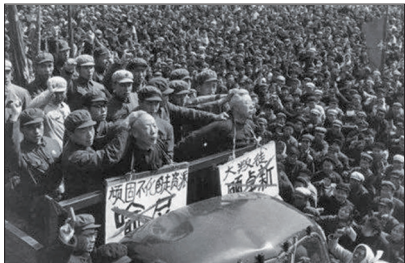
文革批斗惨绝人寰