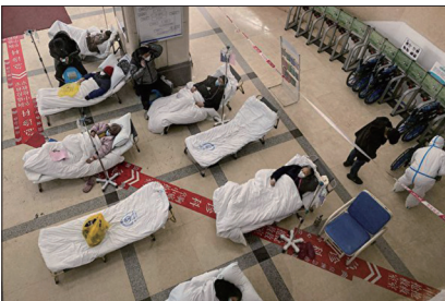
重庆第五人民医院的大厅里摆满病床