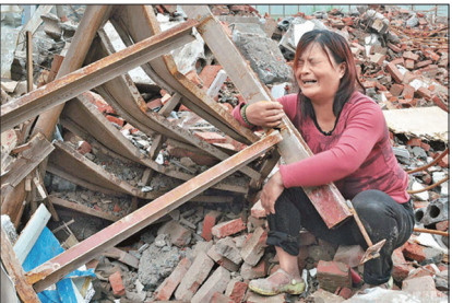
老百姓的房子被中共强拆

中共对内实行独裁政权，剥夺人民的话语权、生存权，公然侵犯人权。中国人的信仰、言论、出版、集会、辩护的权利被剥夺；更垄断控制资讯，动用数万网警监控、封杀国际互联网。中国人的土地、房屋、财产被强占、强拆；正义维权人士、异议人士和为法轮功学员辩护的律师皆遭殴打、绑架和关押、酷刑。中共多年来的暴政持续制造无数的冤民，强拆强徵下造成数不清的家庭悲剧，民怨四起，群体事件频仍。中共的维稳费用已连年超过庞大的军费。