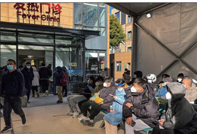
上海同仁医院发热门诊区民众求诊爆满