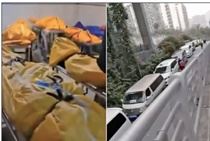
12月22日重庆一间殡仪馆内停放大量遗体，馆外车辆大排长龙。