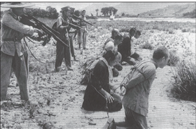
土地改革运动中枪杀地主场面

暴力是共产党取得政权的手段。中共自窃政以来实行恐怖统治。从一九四九年开始，利用镇反、土改、三反、五反、工商改造、镇压宗教、大跃进导致的大饥荒、文化大革命等一系列政治整人运动，导致八千万人非正常死亡，超过两次世界大战死亡人数的总和。相当于在中国发生13次希特勒纳粹的灭绝性屠杀，超过250次的南京大屠杀！中共用阶级斗争理论和暴力革命学说，不断消灭不同范围和群体中的异己分子，至今对法轮功、少数民族、维权人士仍在进行迫害。中共一百多年的历史堪称是一部地地道道的暴力杀人史。