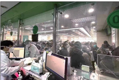
12月10日北京某医院大厅排队人潮