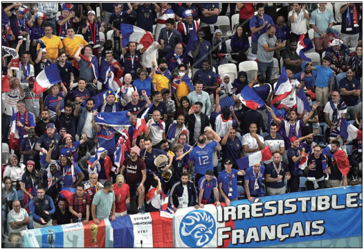
世足赛熱鬧升打，觀賽的球迷無人戴口罩。

欢乐。这些画面触动许多被封控在家看转播的中国人的神经，他们内心非常困惑、愤怒！在其它国家“与病毒共存”的时刻，中国民众却因为中共严酷“清零”而身心俱疲。