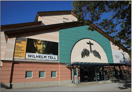
德国巴伐利亚的欧伯阿梅高上演《耶稣受难剧》的剧场。

当年黑死病在德国肆虐时，巴伐利亚的欧伯阿梅高村庄的村民全跪下来向神祈祷，承诺如能幸免于难，他们将以上演舞剧《耶稣受难剧》的形式予以回报和感恩，随即黑死病销声匿迹。