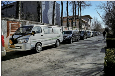
12月22日载着尸体等待进入北京火葬场的灵车在路边排起长队

从12月7日开始各地死亡人数不断飙升，导致医院崩溃，殡仪馆尸体爆满，难以负荷。据自由亚洲电台12月23日报道，北京市官方日前下发“紧急通知”，要求在北京市各郊县对殡仪馆的火化能力进行“紧急扩容”，并在