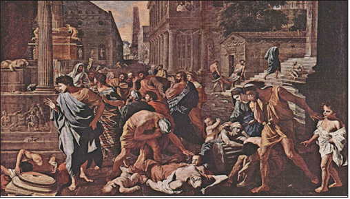
尼古拉斯·普桑 (Nicolas Poussin) 1630年的油画《阿什杜德的瘟疫》

古罗马的四次瘟疫，染疫者死亡后迅速被掩埋消灭传染源。有人抱着亲人的尸体希望染疫一同死去，可是却平安无事：也有人想尽办法预防，却未免一死。瘟疫好像长了眼睛似的。