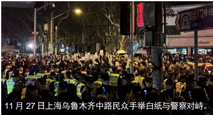
11月27日上海乌鲁木齐中路民众手举白纸与警察对峙。

共产党极端的清零政策造成悲剧连连，11月24日发生在乌鲁木齐的致命火灾，更激怒了在被封锁中苦苦挣扎的中国民众，抗议活动风起云涌，“白纸革命”席卷北京、上海、广州、深圳、武汉、南京等几十个大城市及清华、北大、复旦等几十所高校，愤怒的人们高喊“不要封控要自由”、“共产党下台”等口号。全球华人和英国的牛津、剑桥，美国的哈佛、宾大、哥大、芝加哥大学等顶尖名校的中国留学生，纷纷举行集会声援国内民众。他们带来蜡烛和鲜花，手持白纸、高举标语牌，有的地区选用“推倒那面墙”作为集会的主题曲。