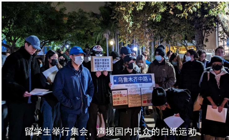
留学生举行集会，声援国内民众的白纸运动。