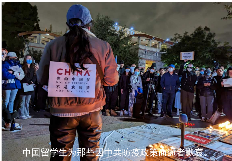
中国留学生为那些因中共防疫政策而逝者默哀。