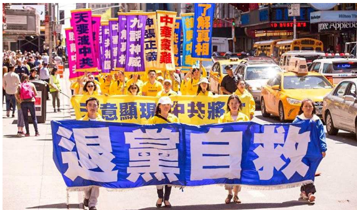
海外华人游行，声援三退大潮。

中共的防疫“错施”对国家经济与人民造成重创，大量公司商店倒闭，民众生活困难。多少人没感染病毒，却死于封控。人们意识到，中共暴政不