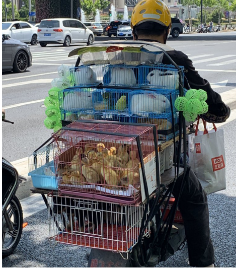
上海市民载着各种小动物去赶集。

上海是长三角经济区的明星城市，中国官方努力打造的国际化都市模范，最光鲜亮丽的改革开放橱窗，但因中共坚持动态清零疫情防控政策，导致经济大幅下滑。据上海财政局数据，上海财政收入2022年上半年比去年同期减少近千亿元。大批企业倒闭，大量小工商业者和工人不是破产就是失业。如今，为挽救经济颓势，欲借助地摊经济复苏，地摊经济可能会勉强解决少量失业人员的基本生存问题，但无法解决劳动力就业以及宏观经济问题。