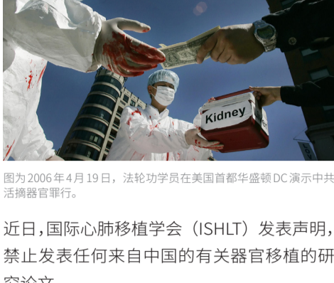
图为2006年4月19日，法轮功学员在美国首都华盛顿DC演示中共活摘器官罪行。

近日，国际心肺移植学会（ISHLT）发表声明，禁止发表任何来自中国的有关器官移植的研究论文。