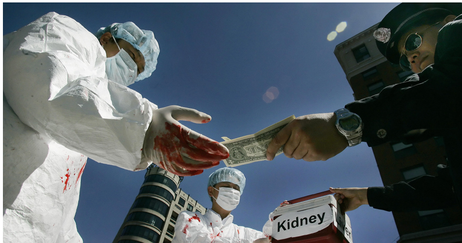
图为2006年4月19日，法轮功学员在美国首都华盛顿DC演示中共活摘器官罪行。

近日，国际心肺移植学会（ISHLT）发表声明，禁止发表任何来自中国的器官移植的研究论文。