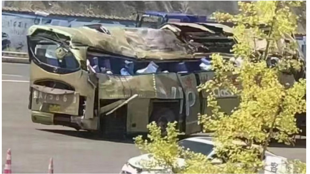
2022年9月18日凌晨，贵阳市一辆运送居民前往隔离点的大巴翻入深沟，造成27死，20伤，翻覆的大巴明显变形。

9月18日凌晨，一辆载有47人的大巴在贵州的黔南州三荔高速公路发生侧翻事故，造成27人死亡、20人受伤，其中45人为贵阳市云岩区涉疫社区的居民，他们要被送往黔南州荔波县的隔离酒店进行隔离。