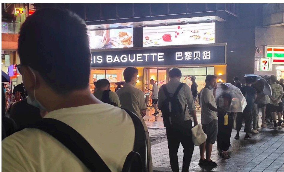
上海市民排队购买“巴黎贝甜”面包，表示支持。

“三退”保平安。神看人心，真名、化名、小名皆可。用翻墙软件登录退党网站： tuidang.epochtimes.com ，声明“三退”（退出中共党团队）。如今，超过4亿人“三退”。全球退党服务中心的“退党（团队）证书”被美移民官认可。