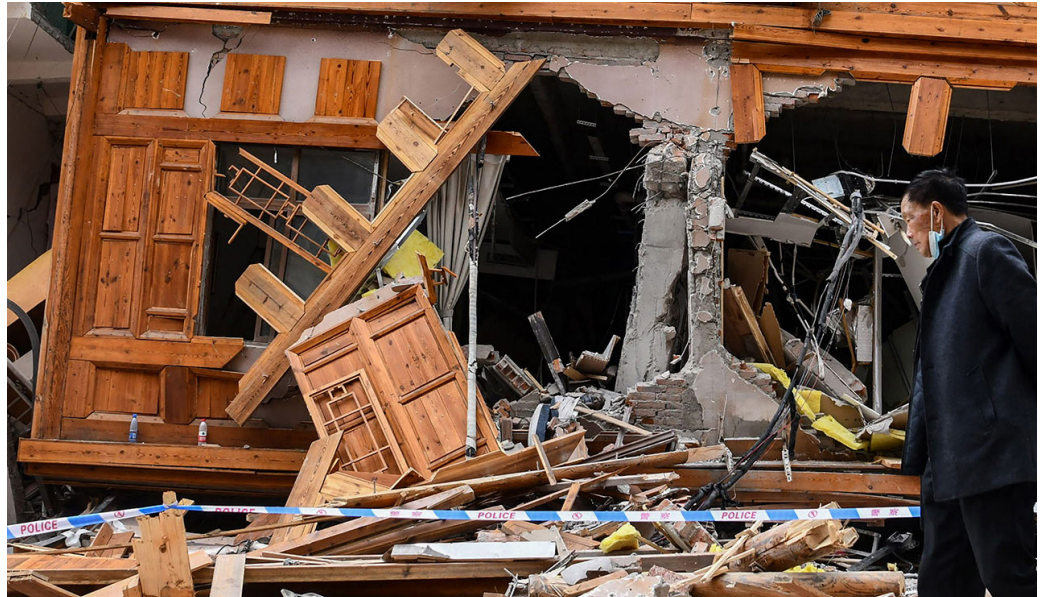
2022年9月5日，四川省甘孜州泸定县发生6.8级地震。

9月5号，四川省甘孜州泸定县发生里氏6.8级地震，且余震不断，截至7日，地震已造成74人遇难，至少270人受伤。因中共惯于造假，外界普遍认为实际伤亡人数远高于中共报道的数字。