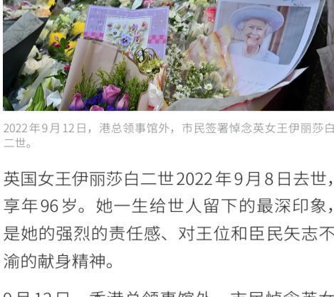
2022年9月12日，港总领事馆外，市民签署悼念英女王伊丽莎白二世。

英国女王伊丽莎白二世2022年9月8日去世，享年96岁。她一生给世人留下的最深印象，是她的强烈的责任感、对王位和臣民矢志不渝的献身精神。