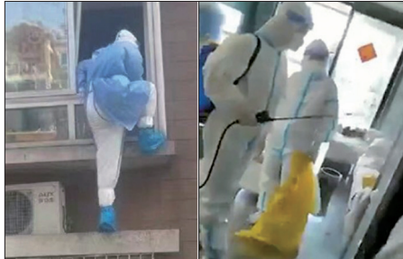
左图为上海防疫人员爬墙翻窗进入居民家中“消杀”。右图为大白闯入民宅消杀。

4月中河南村镇银行爆发弊案无法取款，涉及400亿元人民币存款。为防储户抗议，郑州官方曾将储户手机上的防疫健康码变成有风险的“红色”，限制出行。7月10日约三千名受害储户集结郑州展开维权，却遭到人数更多的警察和便衣人员围困，警民爆发流血冲突。