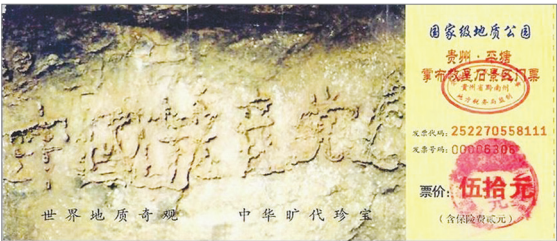
贵州平塘县掌布风景区藏字石门票

中国人加入中共时发誓把自己的一生献给“党”，为其奋斗终生。这样的誓言意味人的生命永远属于党。那么天灭中共的时候，那些发过毒誓，把生命献给它，为它奋斗终生的党、团、队员们，就会成为它的陪葬品。因此只有用化名或真名公开声明三退，才能脱离那些带来不幸灾难的邪恶因素，才能避免成为中共灭亡的殉葬品，才能得到上天的护佑，才能远离灾难和危险，拥有光明的未来！