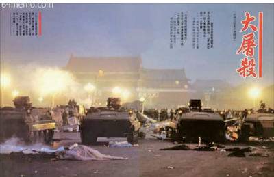
1989年6月4日中共装甲车冲进天安门广场“清场”，死伤无数。