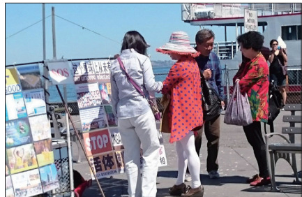
退党义工在旧金山湾区渔人码头帮助中国民众退党

海内外中国民众三退成趋势，在海外各地旅游景点可见退党义工提供三退服务。来自上海的一位市级干部和太太在多伦多的景点遇见退党义工，明白真相后他做了退党声明，并说：“谢谢你们给了我一个好的选择！”旧金山湾区渔人码头的韩