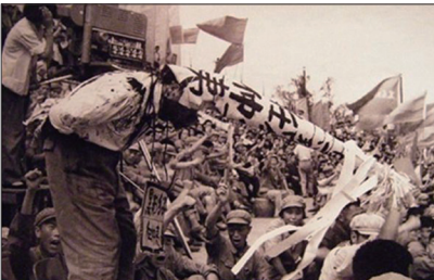
文革是一场浩劫，不仅彻底摧毁中华优秀传统文化，还戕害无数中国人。