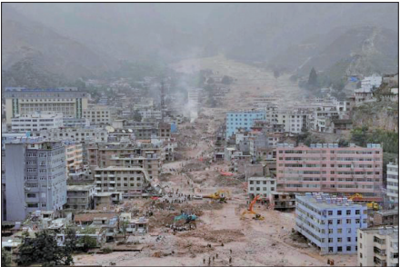
甘肃甘南藏族自治州舟曲县突发特大山洪泥石流灾害。

2010年8月7日，甘肃省舟曲县发生特大泥石流，大片房屋被淹埋在泥石流之下，数千人丧生。灾难无情，不过也有死里逃生的幸运之人。