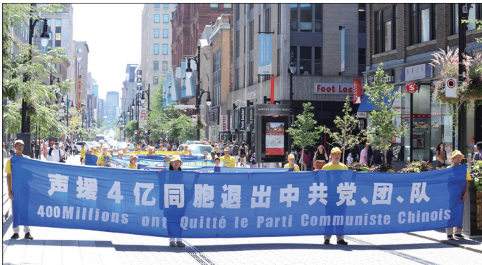
8月6日蒙特利尔举行庆祝四亿中国人三退游行

2004年底大纪元发表系列社论《九评共产党》，引发中国民众退出中共的“三退”大潮。2022年8月3日在大纪元退党网站声明退出中共党、团、队等组织的人数突破四亿。