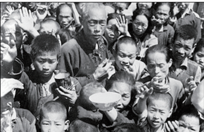
大饥荒导致超过四千万中国人非正常死亡。