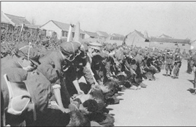
中共在镇反运动中，对已经得到承诺既往不咎的投诚人员也大肆滥杀。