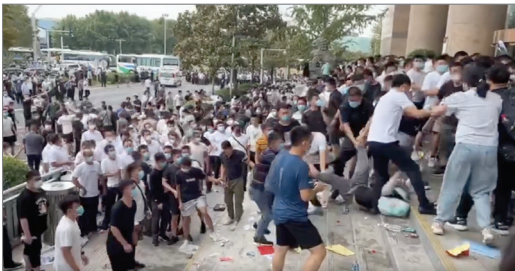
7月10日河南村镇银行受害存户维权，一群白衣人（便衣）开始捉人、找人、踹人。

中共镇压人民的理论基础是“稳定压倒一切”，“把一切不稳定因素消灭在萌芽状态”。中共从来不给人民任何实质性的良性互动管道，它唯一解决人民不满的方式就是群体屠杀。先以谎言骗取再以暴力登场，最后再以谎言掩饰。回顾中共执政历史，走的都是同一条路，丝毫没变过。未来，中共也绝不会因为改换了门面，而改变其邪恶本质。