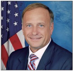
美联邦议员史蒂芬·金

面对共产主义暴政，“退党”不必以暴制暴，是通过道德自我觉醒的方式将共产主义解体于无形，这是和平解体邪恶的上善之法，更是古老的中国智慧。现在“退党”已得到全球多国民众的支持与赞许，当更多的世人明白共产邪灵是在毁灭人类的真相后，“退党”定将成为最耀眼的中国智慧，赢得全世界的尊重与支持！