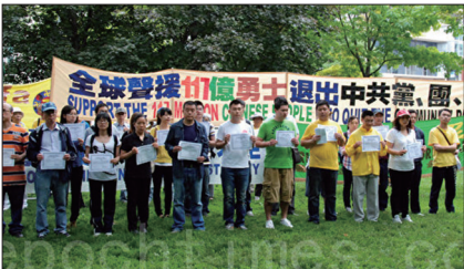
2012年多伦多退党集会现场来自中国大陆21名华人领取“三退”证书。

2016年7月14日美国国会山720大型集会上有9位华人公开退出中共。2017年5月12日纽约“声援两亿七千多万人退出中共”