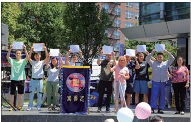
2021年4月18日在纽约集会上七位华人公开三退。

集会现场，有8位中国民众实名三退。2017年4月23日在法拉盛举行纪念4.25和平上访18周年集会，来自大陆的7名年轻人在现场公开宣布三退。2018年4月22日纽约法轮功学员举行4.25游行集会纪念，全球退党中心主席颁发三退证书给18位公开三退的华人。