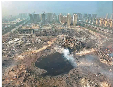
天津滨海新区危化品仓库大爆炸，死伤惨重。

2002年11月中共为稳定政权瞒报非典疫情，导致非典在全球爆发。2008年为保奥运，隐瞒川震预报与毒奶，造成重大伤亡和百万婴儿受害。2015年8月天津滨海新区开发区发生强烈爆炸，中共官方通报遇难者165人。民间估算及外媒报道认为死亡人数超过千人。中共中宣部并且要求大陆媒体统一口径，新闻发布会上中共宣传部官员也一问三不知。