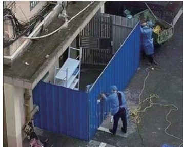
上海封控区的小区门口围铁板，居民宛如被关在笼子里。

2022年中国爆发新一波本土疫情，在中共所谓“极端清零”的防疫政策下，人道灾难频发：母婴被分开隔离，独居老人饿死，病危者无法救治，物资匮乏，对居民强制送方舱隔离，上网求助被封号，不堪压力者自杀身亡。中共官员甚至强制要求居民交出住宅钥匙和离家，并声称要入户消毒杀菌。