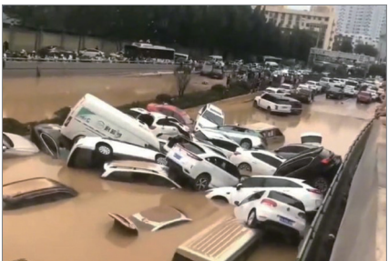
河南郑州市京广隧道在暴雨中5分钟被淹平，数百辆车瞬间没顶。

控，致使疫情扩散全国乃至全世界。2021年7月河南郑州无预警泄洪，造成特大水灾大量人员伤亡惨绝人寰，当局掩盖真实死亡人数。