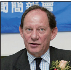
欧洲议会副主席麦克米兰·史考特