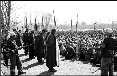
中共土改抢夺地主的房屋钱财，还通过斗地主剥夺人的尊严及夺取性命！