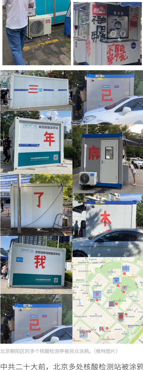
北京朝阳区的多个核酸检测亭被民众涂鸦。