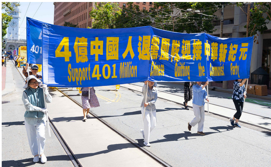
2022年8月20日，美国北加州退党服务中心在旧金山举行盛大庆祝活动，声援四亿中国勇士退出中共党、团、队组织（简称“三退”）。

阿弗拉基亚夫表示，“身为伊朗人，了解极权专制政府是如何对待人民的。很高兴今天有机会了解在中国所发生的事情，同时也了解法轮功修炼者，在中国被迫害但仍坚持信仰。我实在不了解以‘真、善、忍’为修炼基准，有什么错？善，