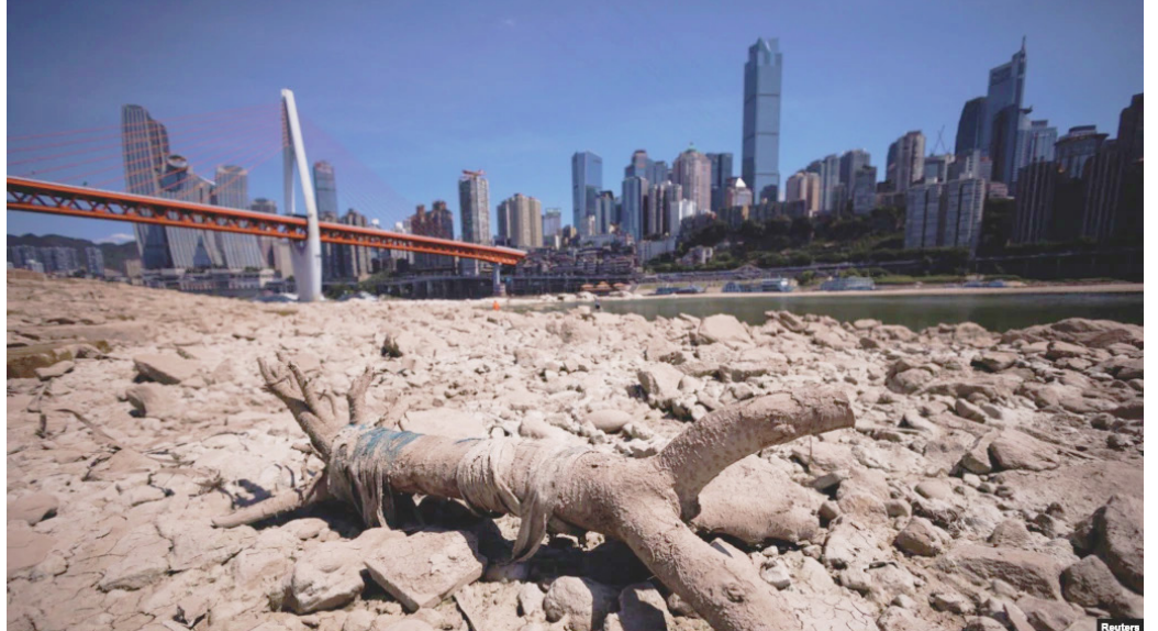
中国重庆段长江因干旱裸露的河床。(2022年8月18日)

四川和重庆连日极端高温，还经常停电或禁用空调和电扇等降温设备。网传信息显示，四川老人和下地农民大量中暑死亡。但官媒均未报导，却将灾难娱乐化以转移视线。