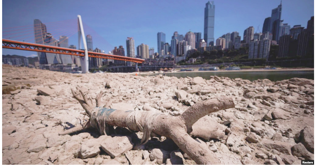
中国重庆段长江因干旱裸露的河床。(2022年8月18日)

四川和重庆连日极端高温，还经常停电或禁用空调和电扇等降温设备。网传信息显示，四川老人和下地农民大量中暑死亡。但官媒均未报导，却将灾难娱乐化以转移视线。