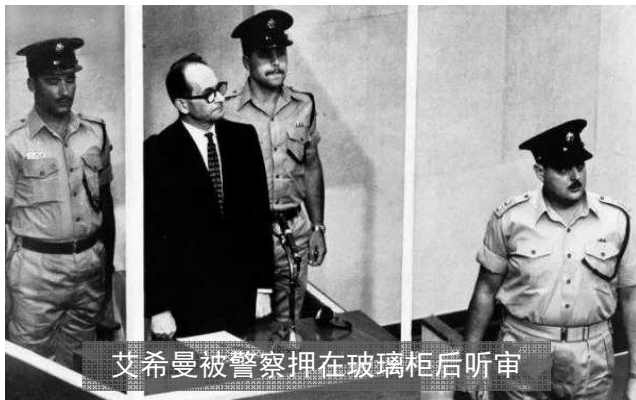
艾希曼被警察押在玻璃柜后听审

1961年12月15日，刽子手艾希曼在耶路撒冷被判判处死刑，隔年5月在以色列拉姆拉遭处死。