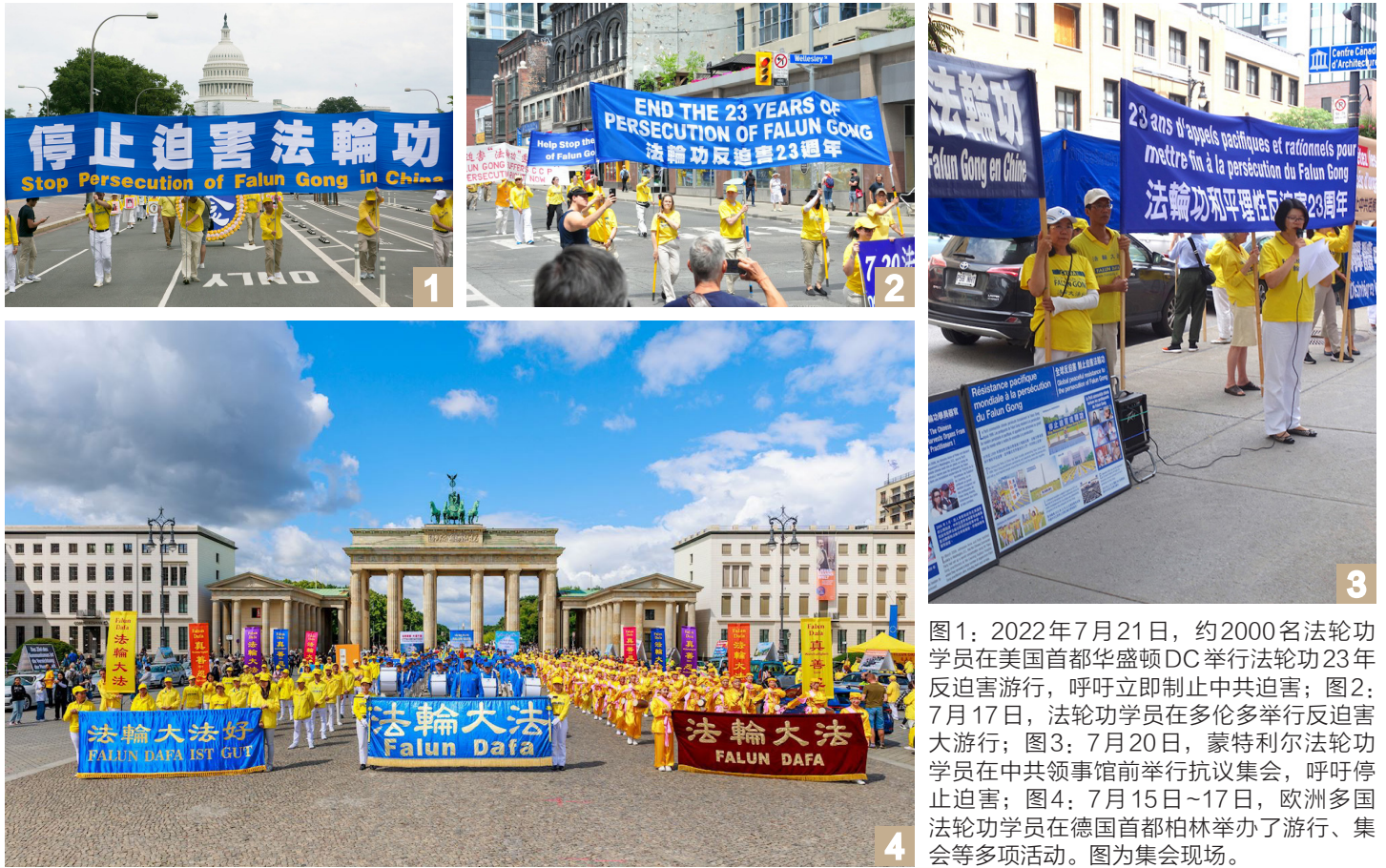
图1：2022年7月21日，约2000名法轮功学员在美国首都华盛顿DC举行法轮功23年反迫害游行，呼吁立即制止中共迫害；图2：7月17日，法轮功学员在多伦多举行反迫害大游行；图3：7月20日，蒙特利尔法轮功学员在中共领事馆前举行抗议集会，呼吁停止迫害；图4：7月15日~17日，欧洲多国法轮功学员在德国首都柏林举办了游行、集会等多项活动。图为集会现场。