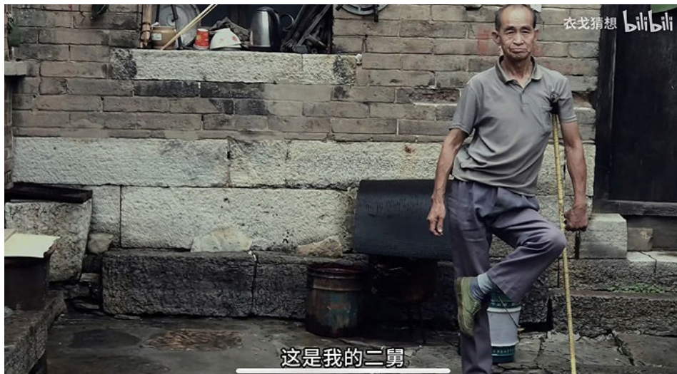
视频《二舅》红遍中国网络，官媒力推宣传“正能量”。（视频截图）

老雷点评说，这个细节说明，二舅既无法对医疗事故追责，也得不到应有的医疗赔偿，他的角色只能是被动地接受苦难。他感觉中国底层民众，很多人只能这样，这反映了中共体制