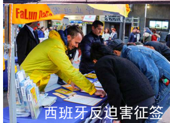
西班牙反迫害征簽