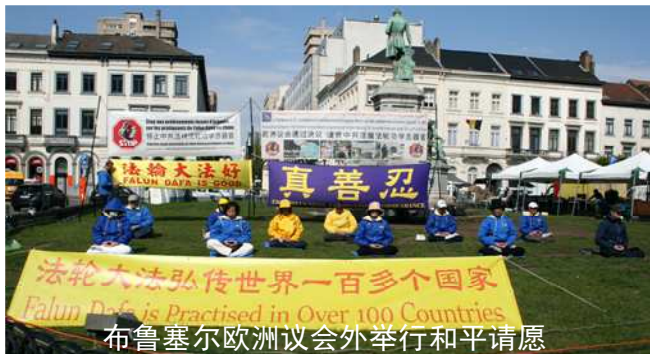
布鲁塞尔欧洲议会外举行和平请愿

◆ 4月26日，部份比利时法轮功学员在布鲁塞尔欧洲议会外举行了和平请愿活动，呼吁制止中共迫害、活摘法轮功学员器官的罪恶。绿草坪上，学员们展示着舒缓优美的五套功法，祥和的场景吸引着欧洲议会外人来人往的各国游客驻足观看。不少人表达自己对法轮功反迫害的支持之意。